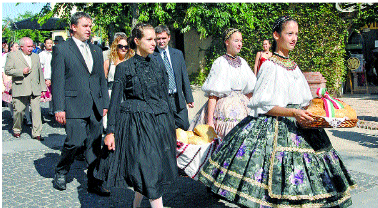
A megszentelt kenyeret menet kísérte a Művészetek Házába