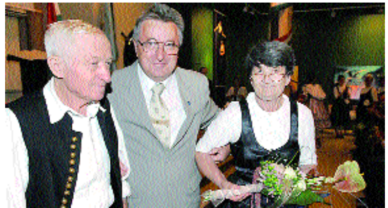
A némettség dívját a Mondschine egyesület kapta