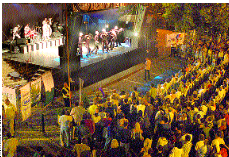
Több ezren látták a Presidance Company látványos műsorát

Államalapító királyunkról megemlékezve folytatta a délelőtt, a Művészetek Házában felvetett gondolatsorát, melyben arról beszélt: "István király