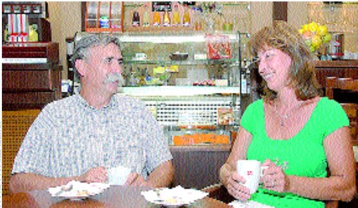
Lelkünkre hatnak: a munkájuk szolgálat

- A szolgálat kitölti a maradék szabadidőmet. Szerencsére a párom pedagógus, jó társam és barátom, aki megérti ezt. A családom nagyon összetartó, ezzel nagy érzelmi biztonságot adnak számomra. Ami igazán pihentető, az az éneklés - a Galigarda kórus tagja vagyok - és a futás. Nagyon fontosnak tartom a testi és lelki egészség egymásra hatását, ezért sokat túrázunk a párommal a szabadban.