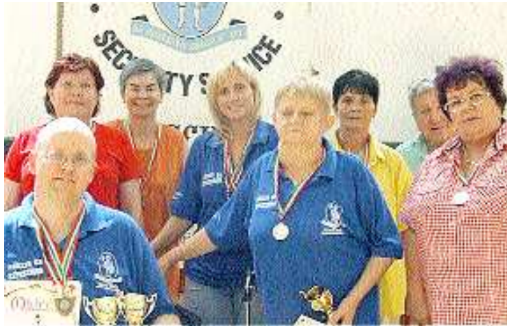
A Fáklya SE Szekszárd csapata eredményesen szerepelt