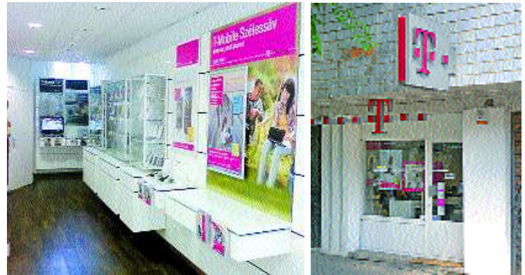
A T-Partner üzlet a belvárosban, a taxiállomásnál várja ügyfeleit

- Cégeket akár soron kívül, előre egyeztetett időpontban is kiszolgálunk