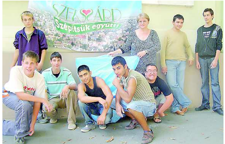
A Tagozat diákjai is kivették részüket a szemétygyűjtésből

Október 5-én a Garay János Általános Iskola és AMI környékét fogják a diákok megtisztítani.