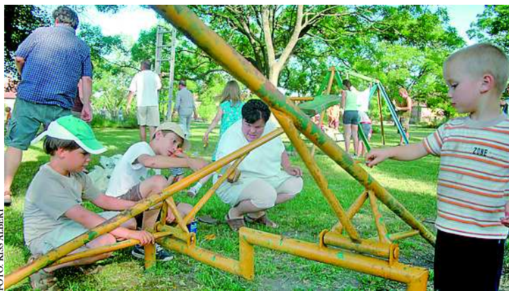
A játszótéri eszközök festésében a gyerekek is segítettek

Kezdeményezésére csatlakozott a pályázathoz a Négy Évszak Waldorf Pedagógiai és a Csiga-Biga Képesfejlesztő Alapítvány, valamint a Magyar Madártani Egyesület helyi csoportja. A mintegy 4500 négyzetméteres parkot négy óvoda és egy általános iskola övezi. A játszótéren és a madárbarát parkon túl további funkciókat is szeretnének adni a közterületnek, a környék lakóinak a bevonásával. Ötleteket, támogatást várnak október 12-én, hétfőn 17 órától a Waldorf Óvodában (Gróf P.