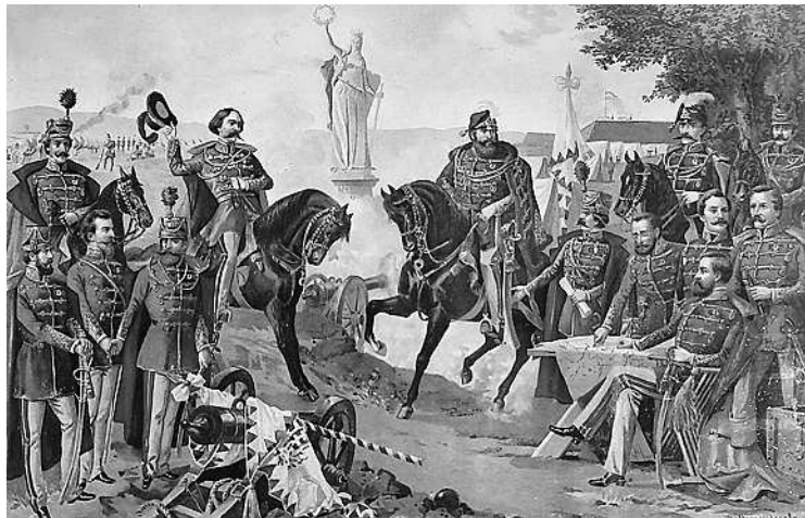
A tizenhárom aradi vértanú (litográfia 1900-ból)

A tizenhármak ítéletét október 6-án – szándékosan a bécsi forradalom