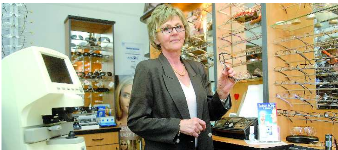
A Szász Optikában a minőséget reális áron kínálják