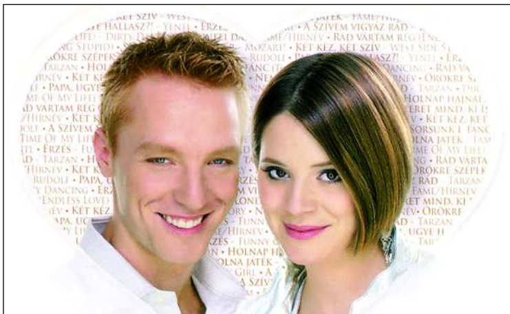
Musical Duett: a művészpár koncertje népszerű

2. Hol tartották a lemezbemutató koncertturné első előadását?