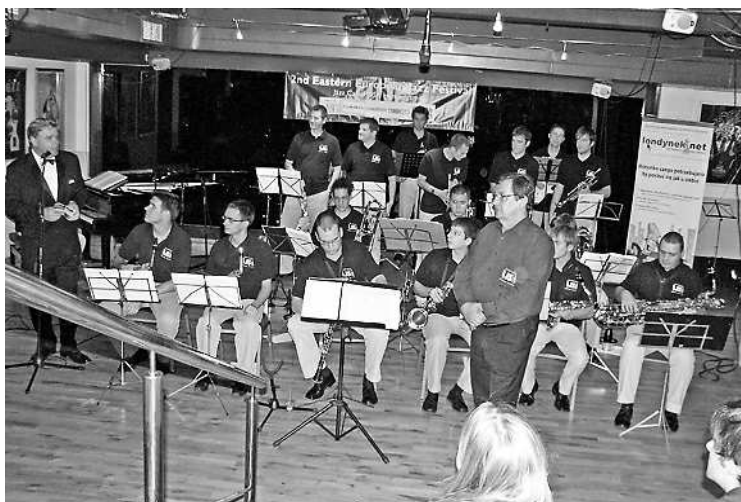
Hammersmith kerület polgármestere köszönti a zenekart

Az égiek igen kegyesek voltak a magyar vendégekhez, a közös városnézés nagyon kellemesen telt, csak esténként esett egy kicsit az eső. A zenekar jelentős része először járt Londonban, így a legfőbb turista látványosságokat vették célba. A kiváló metróhálózatot is sokszorosan kihasználva, kimerítő sétákat tettek, hogy minél több élményben lehesse részük. Megtekintették a Buckingham Palotát és az őrségváltást, a Westminster téren megcsodálták a híres Big Ben óratornyot és az Apátságot, ahol olyan hí-