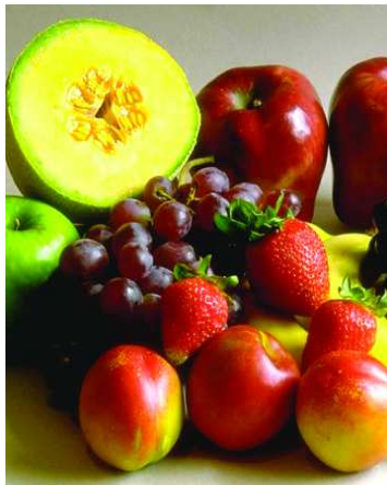
Fogyasszunk C vitaminban gazdag gyümölcsöt, zöldséget

Tény, hogy az elhibázott kommunikáció velejárójaként alig-alig hallani olyan konkrét, összefoglaló és mindenkihez eljutó tanács-sort, amelyek abban igazítják el az embereket, mi a teendő, hogy elkerüljék a H1N1 vírus fertőzését. Éppen ennek pótlására valaki, vagy valakik „összeütötték” az influenza elkerülését segítő tanácsokat „H1N1 – hogyan csökkenthető a rizikó” címmel. Javaslatok elfogadását és a tippek napi alkalmazását ajánlják mindazoknak, akik már beoltatták magukat, s azoknak is, akiknek fenntartásai vannak a vakcinával szemben. A felhívás e-mail-ben terjed, talán gyorsabban a vírussal. Erre abból következtetek, hogy én magam már három egymással egyező tipp-sort kaptam az ország különböző vá-