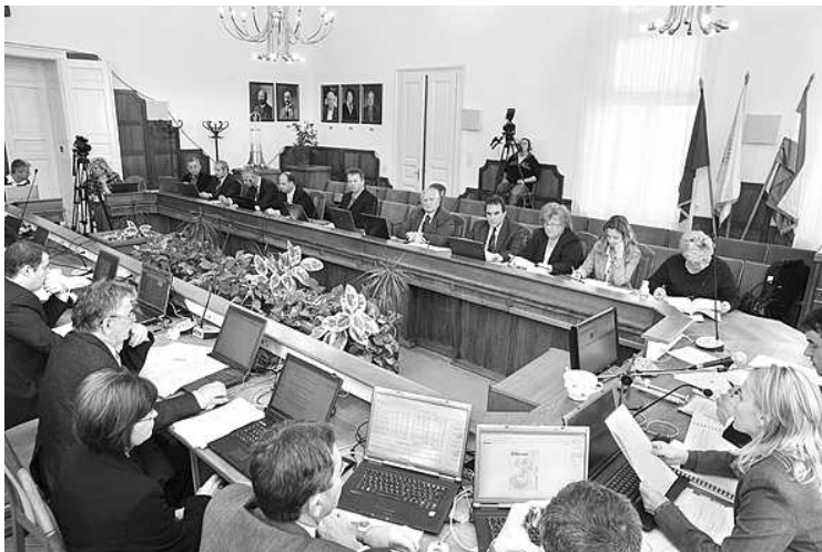
Munkában Szekszárd város közgyűlése

Mivel ez mindkét fél érdeke, a képviselők egyhangú szavazással hosszabbították meg a helyi személyszállításhoz szükséges közszolgáltatási szerződést 2016. december végéig a Gemenc Volánnal. Az is eldőlt, hogy idén december 17-én 16 órakor tartanak közmeghallgatást, melynek té-