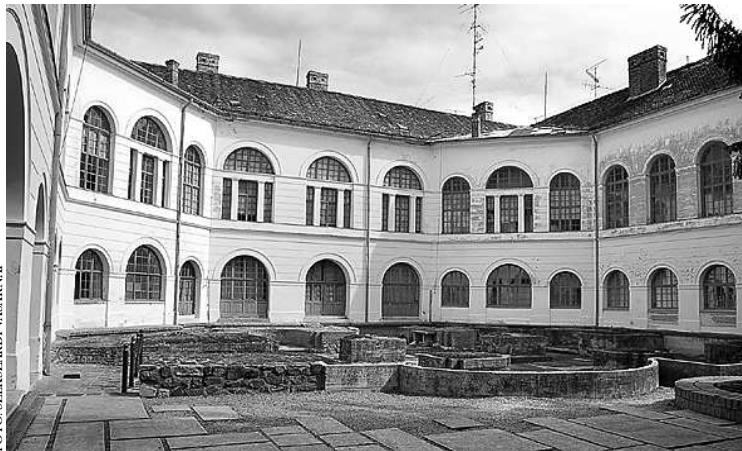
A felújítás után eredeti pompájában ragyoghat az épület

A kivitelezés várhatóan 2010 nyarán indul meg, jó esetben 2010 végére be is fejeződhet. Az elnök úgy fogalmazott, az előnyöknek 2011-től lehet haszonélvezője a nagyközönség. Valóban a nagyközönség, hiszen az épületet arra is felkészítik (egy mobil színpadot is terveznek), hogy állandó fesztiválok központja is legyen. Ez kapcsolódást jelent a Béla tér és környékének átalakításához, hiszen az ott levezényelendő munka szintén szolgál hasonló célt: jelesül azt, hogy a patinás tér is a város életének egyik kulturális centrumává váljon. A megyeháza díszterme fizikailag is megújul, teljes mértékben alkalmas lesz magas színvonalú konferenciák, tanácskozások, tudományos értekezletek megtartására is.