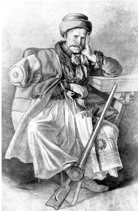
Lövés előtt (Szemlér Mihály: Szegénylány című rajza)

nevet, de e célból is sokkal helyesebb az ifjabb vagy az idősb jelző, esetleg a házszám alkalmazása, mint a feleség nevének kitétele. Nálunk azonban ez a szokás annyira túlteng, hogy a feleség nevét – ha van szükség a megkülönböztetésre, ha nincs – mindenkor kiteszik, és így Tolna megye területén alig van olyan földműves választó, aki felesége neve nélkül díszítené a név-