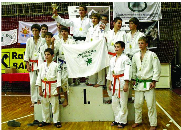
Csapatversenyben nincs jobb a Gemenc JK serdülőinél

Összességében jól mentek a dolgok az első napi egyéni küzdelmek során, még ha egy-egy szerencsétlennek tűnő vereség bebecsúszott a szekszárdiaknál. Ez pedig egyet jelent azzal, hogy az illetőnek le kell mondani a hón óhajtott aranyról. Ha a visszamérkőzések során hibátlanul menetel, akkor jöhet a bronzmeccs. Szepesi József