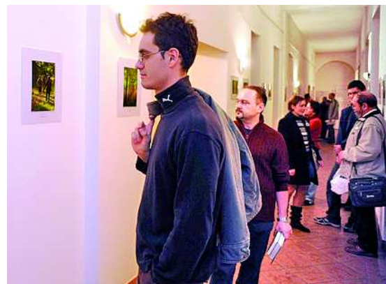
A folyosógalérián megnyitott kiállítás célja: felhívni a figyelmet a Gemenc kétarcúságára