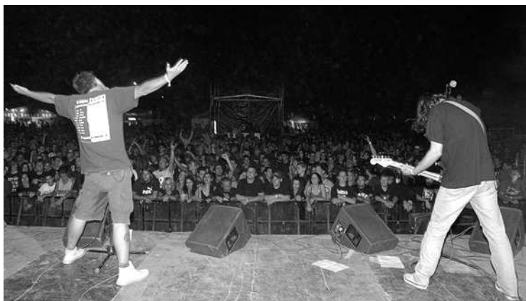
Ma is telt házas koncerteket ad a Prosectura