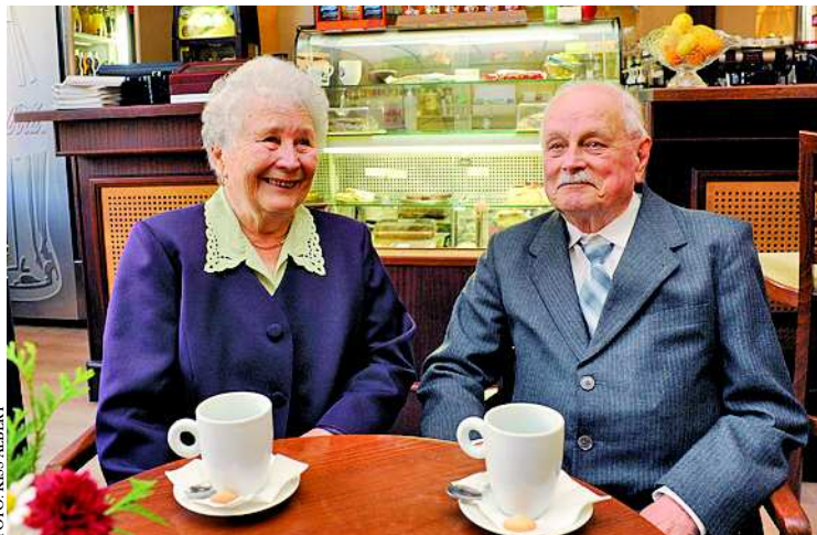
„A kölcsönös bizalom és őszinteség nagyon fontos”