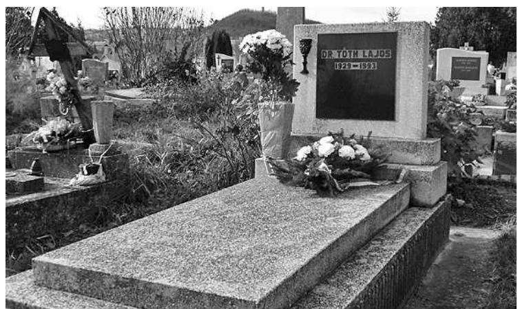
Dr. Tóth Lajos sírja az újjvárosi temetőben

Barátai, tisztelői és Szekszárd város önkormányzatának képviselői tisztelegtek csütörtökön dr. Tóth Lajos emléke előtt. A POFOSZ és más civil szervezetek tagjai az újjvárosi temetőben helyezték el az emlékező virágait dr. Tóth Lajos, az 1956-os forradalom és szabadságharc szekszárdi Nemzeti Bizottságának elnöke sírján, aki 28 évesen állt a változást akarók csoportjának élére. A megtorlás után 8 év börtönre ítélt, amnesztiával 1961-ben szabadult jogász és társai nevét a jövőnek megőrző, a városháza aulájában található márványtáblán dr. Haag Éva alpolgármester és Töttös Pál, az Nemzeti Bizottság egyetlen élő tagja helyezte el koszorút.