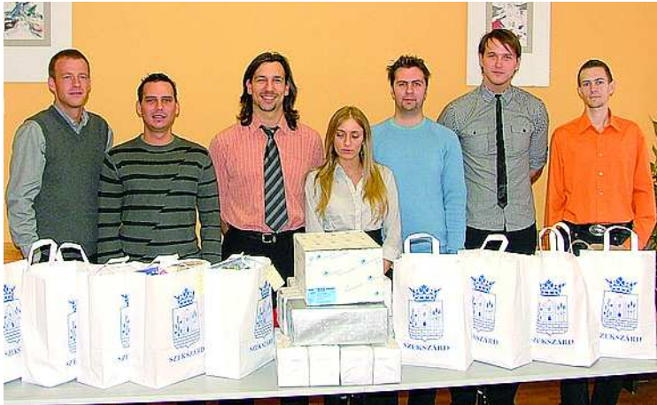
A FITT Egyesület hagyományt teremtene a gyűjtésből

■ Hagományteremtő szándékkal közel 60, az erdélyi gyergyószárhegyi kólostorban élő, tanuló gyermek karácsonyát teszik szebbé azok az ajándékcsomagok, amelyeket a most alakuló Fialatok Tolnában Tolnáért (FITT) egyesület tagjai állítottak össze.