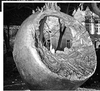
Gyűrűkert: Szatmári Juhos László alkotása a megyeházán

- A szoborra tekintve ismerős a dímbes-dombos táj, és megpillantva a templomot értjük, hogy többről van itt szó, mint a minden településen feltehető Isten házáról - hangsúlyozta az elnök. - Ez a templom a bennünket ezer esztendeje megtartó kultúránk, civilizációnk szimbóluma. Templom, amely köré szerveződik település, közösség, amely a megmaradáshoz támpontot ad erkölcsben, és amely figyelmet bennünket múlandó és mara-