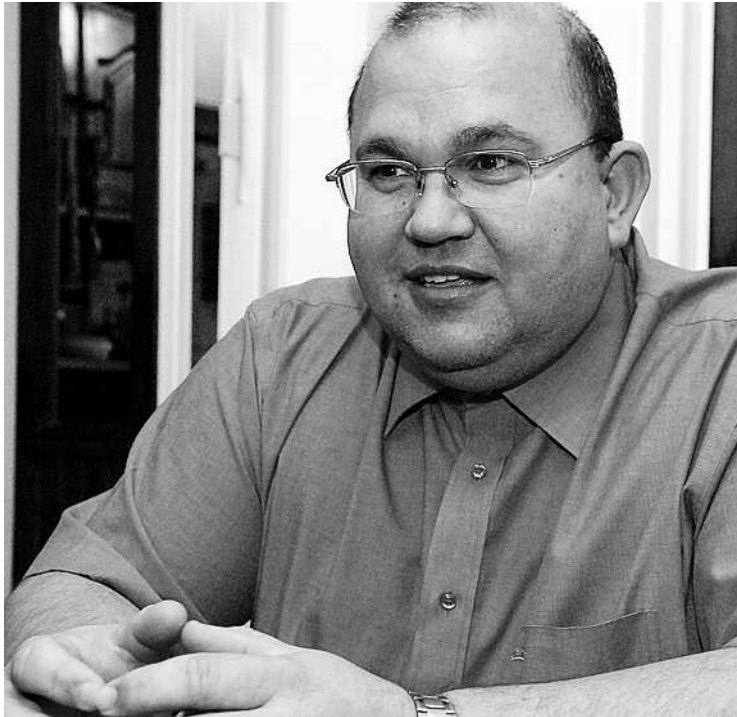
„A számokhoz való hűség és a rendezettség most is megvan”