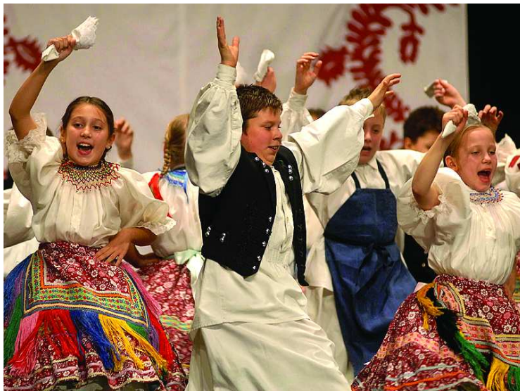
A Bartina gyermekcsoportjának műsora mindkét nap elbűvölte a színháztermet zsúfolásig megtöltő nézőket

A péntek, majd a szombat esti évzárón egyébként a Bartina nyolc korszaltájának háromszáz fiatalja szórakoztatta színpompás, ezzel együtt a tiszta forrásból eredő művészet kavalkádjával a nagyerdeműt. A csapatok egymás után léptek színpadra és tettek tanúbizonyosságot tudásukról, ezáltal felkészítik gondos és lelkiismeretes munkájáról. Nem maradt el a nagyszabású zárókép sem, mely a közös éneklés révén