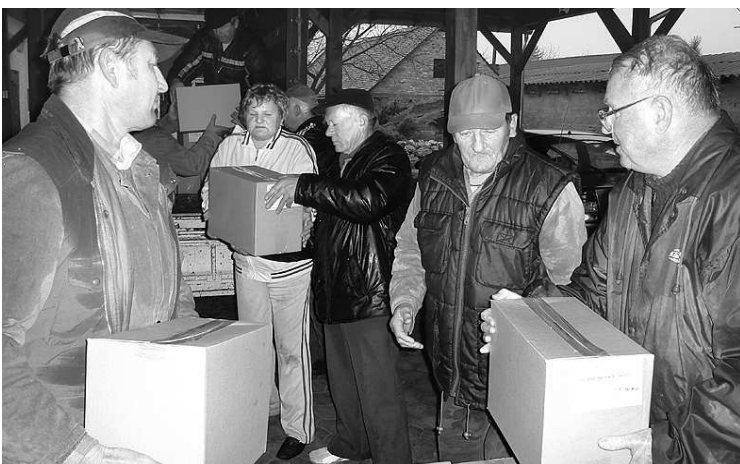
A Szent István ház udvarára érkezett az uniós élelmiszer-szállítmány

Ezerháromszáz család karácsonyát szépítik meg