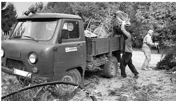
Az illegális személtlerakás megakadályozása is program része

Az első megbeszélésen a város és a rendőrség mellett, részt vettek a polgárőrség képviselői, illetve valamennyi biztonsági cég. Már ez a találkozó is számos tanulással járt. Lehet, hogy célszerű a város területét a szerint is felosztani, hogy adott időben melyik