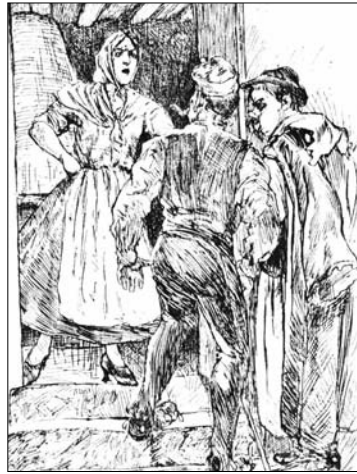
...és a házi őrmester

Azt már a másik nagy adomavadásztól, Gracza Györgytől tudjuk meg, milyen fejlemény volt aztán a lagúnák városában. „- De hát mikor el-