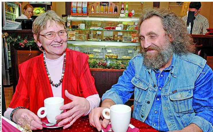
Ketten több mint kétszáz alkalommal adtak már vért

– Ma, amikor ennyi a beteg ember, ha mással nem tudnak segíteni, akkor legalább aki egészséges, tegye meg ezt a lépést. Boldog lesz, hogy a vérrel más embereken segít.