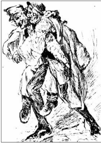
Munkában az obsitos...

közepén olyan egy város van, keresztül-által tizenkét mérföldnyi! – Talán valami sziklás helyen épült? – Nincsen ott egy talpalatnyi föld is, sem egy morzsányi kő, mégis ott áll a város a tengernek kellőközepében. – Vajon, hogyan építették mégis? – Csak úgy – mondja nagy könnyen az obsitos – mikor befagyott a tenger, addig hordták a jégre a szalmát, meg a fagyra addig öntözgettek újra vizet, hogy a jég úgy megvastagodott immár, hogy akármi nagy házat könnyen elbírhattott.” A meleg fölelmegetésére meg azt válaszolta: „Ne is higgyed öcsém, hogy azelőtt ilyen volt a világ! Száz esztendő múlva mi miattunk újra megint fagyhat.”