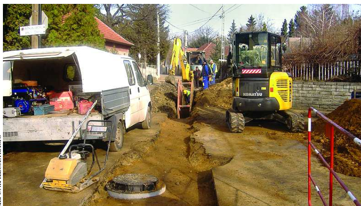
Tavasszal indulhat a szennyvízcsatorna-beruházás Szekszárdon

Az idei évre előirányzott 60 milliós felújítási keret év közben még további 10 millió forinttal egészítették ki, amely lehetővé tette a további munkákat. Ilyen volt a Dózsa György