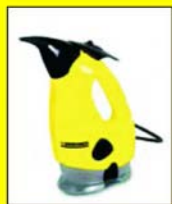
SC 952 kézi gőztisztító