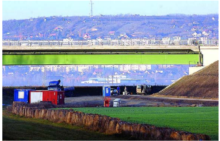
Az új Sió-híd szinte teljesen kész