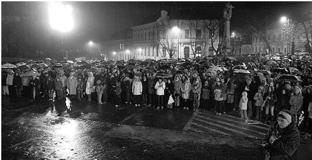
A zuhogó eső ellenére idén sokan búcsúztatták az óvet a Béla király téri Örömnépen