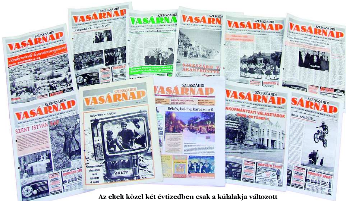
Az eltelt közel két évtizedben csak a külalakja változott

A huszadik évfolyamát kezdte az 1991-ben indult városi hetilap