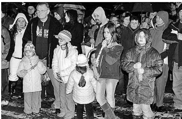
A gyerekek színes trombitákkal érkeztek

Az Örömnépen főtámogatója: Paksi Atomerőmű Zrt. Támogatók: Szekszárdi Diákéletfejlesztési Kft., Szekszárdi Kisgazda Polgári Egyesület. Együttműködő partnerek: Alisca Terra Kft., Jamner Fotó, Szekszárd MJV Önkormányzata Hivatásos Tűzoltósága, Tolnatáj Televízió, Tücsök Zenés Színpad