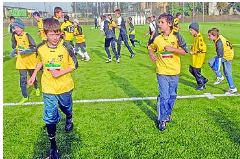
Műfüves pálya: hivatalosan még nem adták át, de az UFC fiataljai már birtokba vették

Az év szekszárdi sportos szponzorációi: A Tűzköbirtok támogatói megjelenése az UKSE Szekszárd kézilabdacsapatánál, valamint Tolnatej Zrt. és az UFC Szekszárd között létrejött együttműködés.