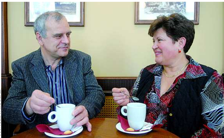
Három évtizede segítenek világra kis embereket

- Sajnos a megyében nincs szülész-nőképzés. Kevesen választják ezt a hivatást, hiszen nálunk az ünnepek is olyanok, mint a hétköznapok. Másrészt egy lelkiileg, szellemileg, fizikailag nagyon megterhelő tevékenység, amit 12 órában végzünk, s ezt a hosszú műszakot már 28 évvel ezelőtt vezették be. A fizetés pedig... Ahogy az egész egészségügyben: kevés. A „legszebb” fizetés azonban a mi hivatásunknak van, amikor egy egészséges anya egészséges gyermekkel a karján tér haza otthonába.