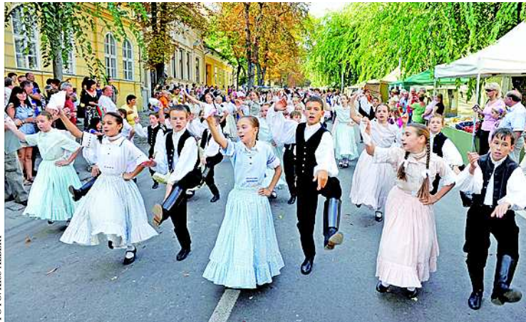
A fesztivál talán leglátványosabb programja a szüreti felvonulás

A Székesszárdi Szüreti Napokat az úgynevezett speciális kategóriába sorolták, amelyben csak nyolc fesztivál szerepel. Információink szerint pontszám alapján az első három közt szerepelt Székesszárd. Kiemelt helyét mi sem bizonyítja jobban, mint hogy a