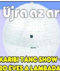
KARIBI TÁNC SHOW - 20 ÉVES A LAMBADA

Újra az arénában, a 70-es, 80-as évek zenéivel!