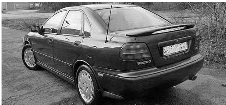
Tizenegy éves Volvo 200 lóerővel: januártól luxusautó-adó terheli

Am ha a gépjárműnek teljesítménye szerény, adót akkor is fizetnie kell,