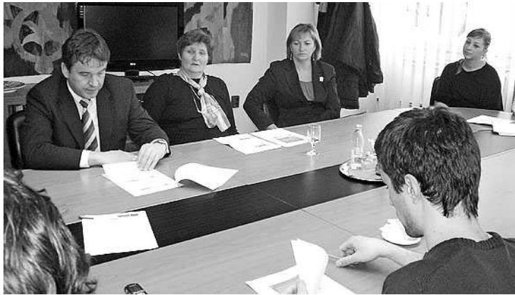
Sajtótájékoztatót számoltak be a nyertes pályázatról

A projektet megvalósító partner szervezetek a Babits Mihály Művelődési Ház és Művészetek Háza koordinálásával a gyermek- és ifjúsági korosztály, valamint a hátrányos helyzetűek körében kívánnak bevezetni, illetve megújítani olyan, a nem formális és informális tanulási programok körébe tartozó szolgáltatásokat, amelyek segítségével növelhető a település formális oktatásának hatékonysá-