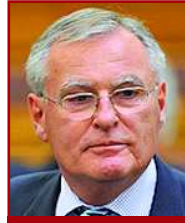
Dr. Balsai István