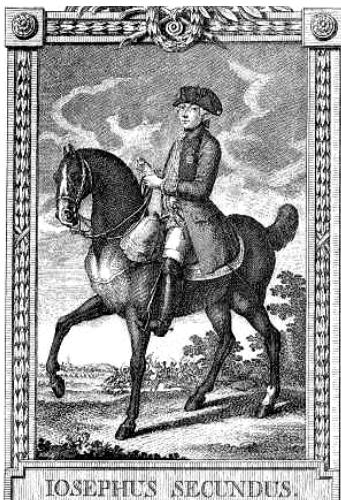
II. József (Mansfeld metszete)

auch beierische Dampfnudel machen?” Ezt felelte rá a pincér: „Ja Eur Majestät, essen kann ich es, aber machen nicht”, ezért aztán a pincér egy aranyat kapott a császártól. (Részben lefordíthatatlan szellemesség, de úgy értendő: – Tud a bajor gőzgom-bócról tenni? – Igen, őfelsége, enni igen, de készíteni nem tudom.)