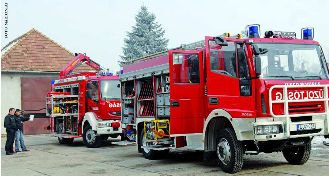
Képünkön elől az Iveco gépjármű-fecskendő, mögötte a műszaki mentőszer, a Renault Midlum

Az eszközállomány 3 év alatt 310 millió forint értékű felszereléssel bővült