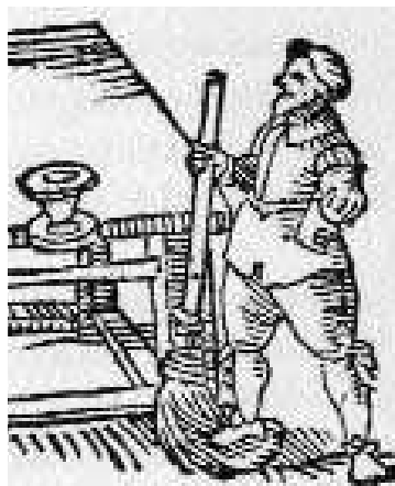
Így nézett ki egy bajor pincér (egykorú matematikakönyvből)

Ugyancsak a Garay tüszentő diákjától tudjuk: annyira megszerette az itteni források vizét, hogy a harctérre is maga után vitte – a helybeliek legnagyobb megrökönyödésére. Ők e háborúban méltán lehettek büszkék borukra, mert Farádi Vörös Ignác mindvégig ragaszkodott ehhez hadsereg-élelmészeti cikként. A török háború megvesztegethetetlen hadbiztosa titkára maga a császár is kí-