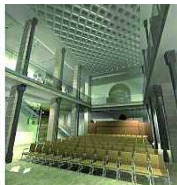
A terveken így néz ki a felújítás utáni művelődési ház és a Művészetek Háza

rek kialakításának fontosságáról beszélgettünk.