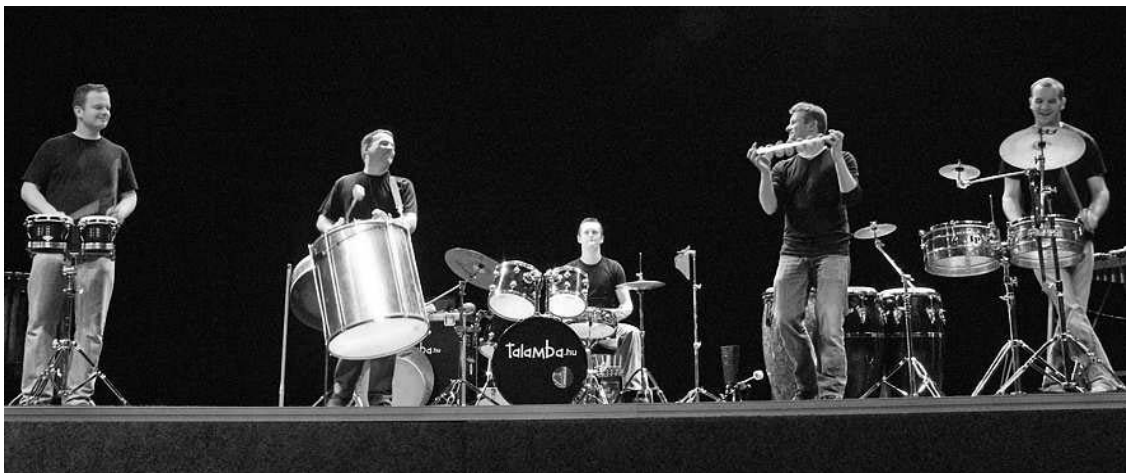
A gödöllői Talamba Ütőegyüttes remek hangulatot teremtett

Majd áthajóztunk Latin-Amerikába, ahova a behurcolt afrikai rabszolgák