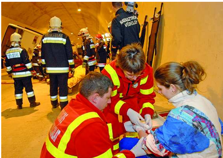
A tűzoltók, a mentők, rendőrök és a katasztrófavédelem szakemberei összehangolt mentési gyakorlatot tartottak az alagútban

Feladatrendszerükről szólva az ezredes kiemelte, hogy szakhatósági feladataik között nagy súlyt fektetnek az ipari balesetek megelőzésére, s megjegyezte, hogy megyénkben magas a veszélyeztetettség fok. A veszélyes anyagok közötti szállításának szabályosságát is rendszeresen ellenőrzik, ahogyan a telephelyeken is rendszer-