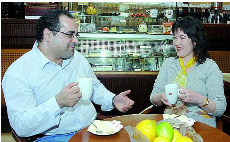
Mindketten az egészségügyben dolgoznak

– Az utazás is, bár én jobbra inkább hazautazom a szabadság alatt, viszont érdekes módon olyan helyekre kívánkozom, amelyek addig nem voltak fontosak, amíg ott éltem. Idehaza két kutyámmal töltöm a szabadidőm nagy részét, ami friss levegőt és mozgást, de ismeretesség kötését is jelenti egyben.