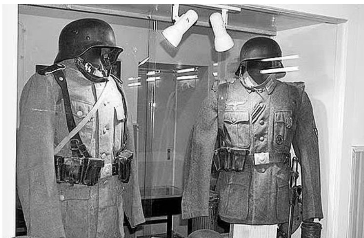
Német egyenruhák a Baka Múzeum egyik vitrinjében

B. Gy.: – Augusztus 20-án lesz a pécsi egyházmegye felkérésére egy komoly, egy hetes numizmatikai világtalálkozó. Ott segítünk be néhány relikviával.