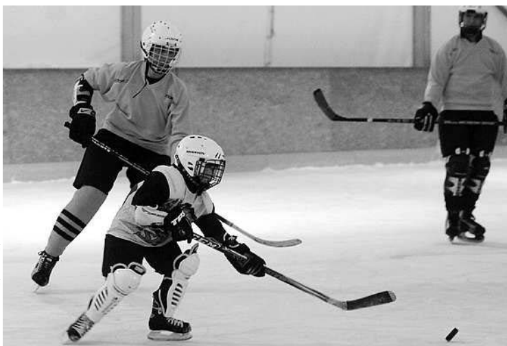
Nagyon népszerű volt idén a városi jégkorongbajnokság

– A működés eredményes volt, pozitív eredménnyel zártuk a szezont. A