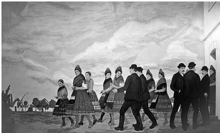
A Sárközi vasárnap műtárgymásolata a decsi faluházban látható