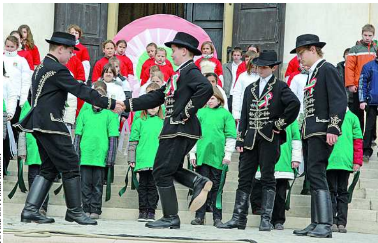
A Dienes iskola diákjai kalauzoltak végig a forradalom eseményein

telbe, élnek létbizonytalanságban, vagy mennek tönkre, s tízezrek hagyják el hazánkat jobb életfeltételek, munkalehetőség reményében. „Tudjuk és érezzük, hogy Magyarországnak, a magyar nemzetnek változásra van szüksége!” – folytatta Horváth István. A polgármester szerint a XIX. századi hazaszeretet olyan példa, mely erőt adhat jelenünkben is. A jövőt a mában kell megnyernünk, s jövőnk útját saját magunknak kell megépítenünk, mivel csak magunkban bízhatunk. Ezt a hitet viszont nem lehet hazugságokra, korrupcióra építeni!