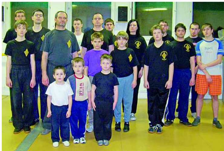
Felnőttek és egészen fiatalok is járnak a csoportba

A másik nagyon fontos stílusjegy a tapadós kezek, a Chi Sao. Ez azt jelenti, hogy nem mennek el az ellenfél elől, hanem hozzátapadnak. Így akkor is tudják, hogy mire készül, ha nem látják, hiszen a mozgásából érzik a kezünkön keresztül. Amíg nincs lenn