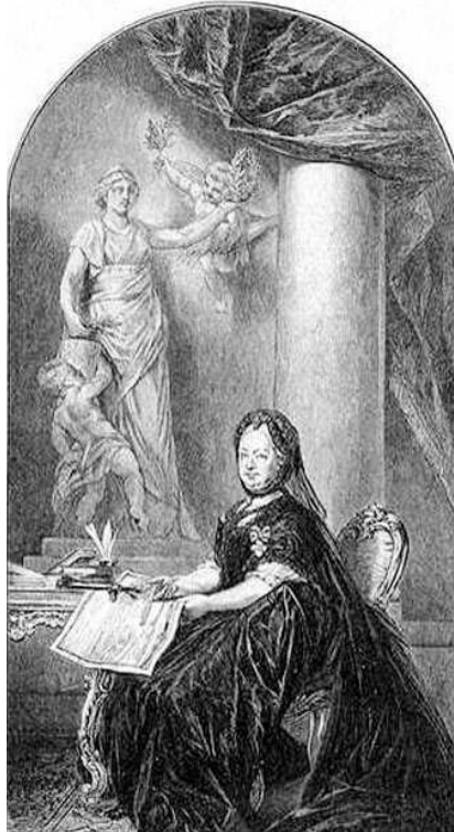
Mária Terézia, az alapító