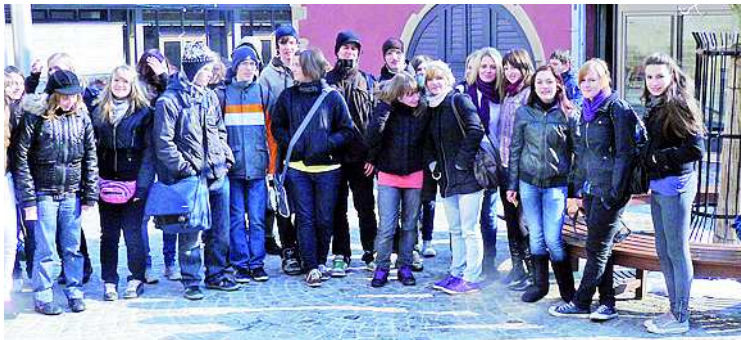
A Németországban járt garays csoport

Bietigheimben egész nap gyakorolták a nyelvet, még az esti közös sétánál, magyar társaikkal is németül beszéltek. Németországban más jellegű tanítási módszereket tapasztaltak: lazább órákkal, szabadabb óravezetéssel. A tanítási módszer jobban tetszett, mivel nem azonnali képletmegoldással indítanak. „Felvetik a problémát, s abból kiindulva kell találni valamilyen megoldást” - tették hozzá. Sajnálatosan tapasztalták, hogy a német