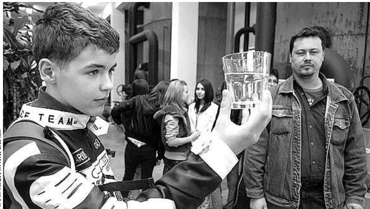
Bárki meggyőződhetett róla, hogy tiszta víz kerül a pohárba

Az idén 329-en tettek látogatást ezen a napon a Bogyziszlói úti víztisztító telepre, száztizennégyen a szennyvíztisztító telepre is kilátogattak, de akadtak olyan csoportok, akiket a laboratórium mellett még a víz-órájavító is érdekelt. A helyszíni látogatáson mindenki meggyőződhetett, hogy a Vízmű Kft. a minőség védelmében mennyire fontosnak tartja a folyamatos laboratóriumi vizsgálatokat, és a hálózat tisztítása is hangsúlyos a mindennapi tevékenység során. Minekután kijelenthető: jó minőségű a szekszárdi csapvíz. Ha előfordul néhol az állottság nem kellemes látszata és érzete, nem feltétlenül a szolgáltatóra kell mutogatni, mert