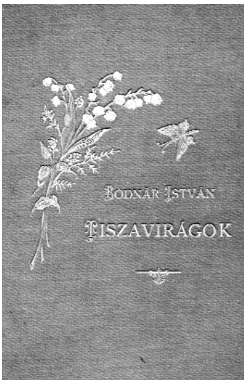
Aranyozott, ezüstözött könyv – sok kötethez illő címmel

nem kell szólunk: Babits Mihály, Bakai István, Garay János és Mészöly Miklós, akinek szintén jelent meg verseskötete.