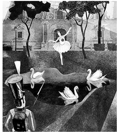
Az ólomkatona és a balerina