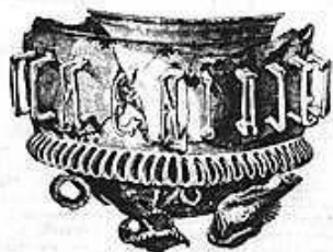
Az első és legmaradandóbb egy-soros a vasa diatretán

130 éve, 1880-ban a Vasárnapi Ujság Garay János egy ifjúkori levele címmel becses emléket közölt. 85 éve, 1925-ben hunyt el múzeumunk alapítója, gróf Apponyi Sándor.