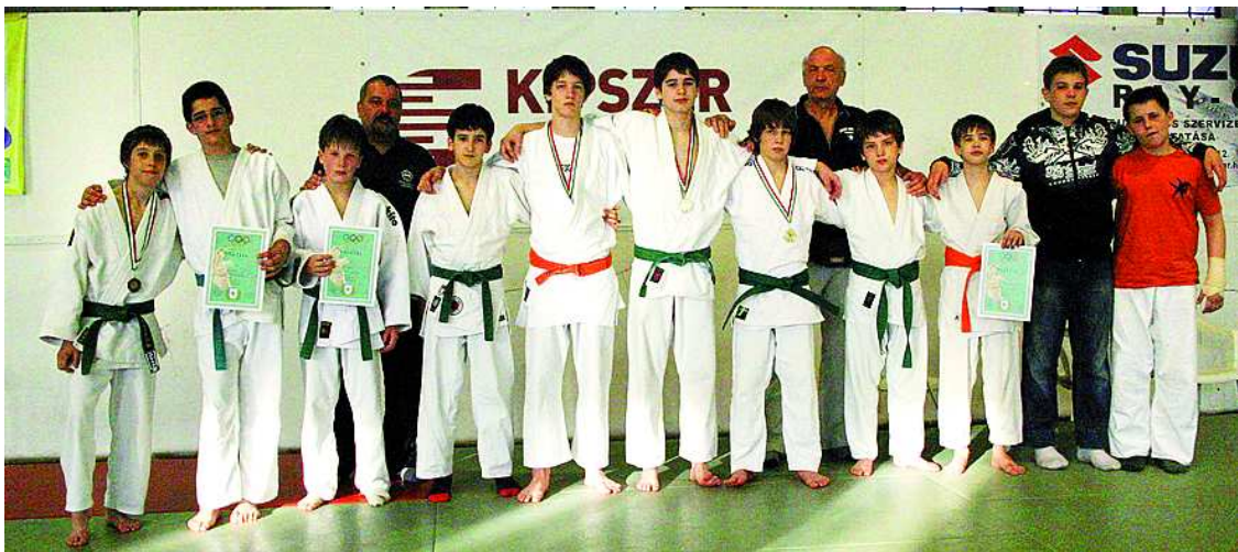
Három érmet és több ötödik helyezést szerzett a Gemenc JK csapata