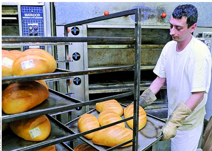
Hetente tízezer kenyeret sütenek a Pannon Varázs pékségében

A cég további fejlődésének lehetőségét keresve a tulajdonos profilbővítést határozott el, és száraztésztagyártó üzemet létesített Medinán. A tesztüzem 2007-ben sikeresen vett részt a