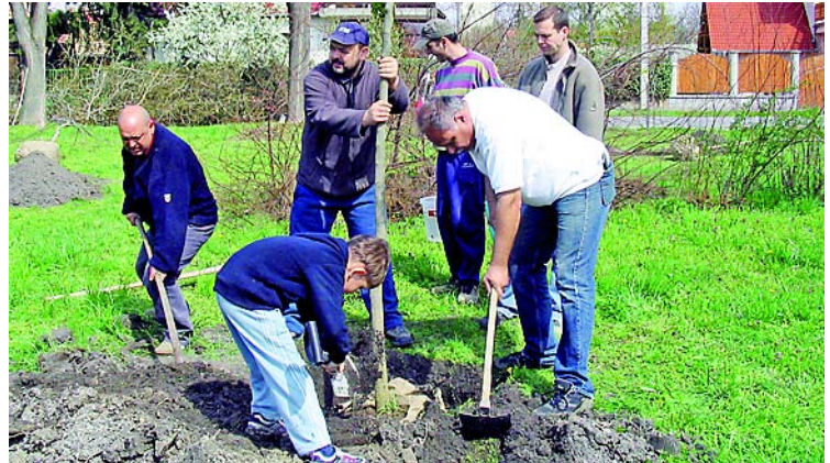
Lakossági összefogással lett madárbaráttá a Prantner János park

Szombaton a Prantner János parkban 17 darab fát és 70 darab cserjét ültettünk lakossági összefogással. A park madárbaráttá alakítása jó hangulatban telt, melyet a Waldorf Négy Évszak Al-