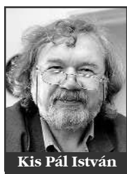
Kis Pál István

■ A jó sztoriban „csak úgy történnek a dolgok, nem csinálják őket” – fogalmazza meg a remek meseszöveg alapját pléhfater pléhboj kérdésére. Ez az egyik legfontosabb jellemzője Kis Pál István legújabb kisregényének, amely a Pofonok és pofonok... címet viseli: az életből születő események maguktól gördülnek tova. Annak ellenére van ez így, hogy a rövid történetek, szám szerint tizenhét, egy keretbe ágyazva hangzanak el; ugyanis a két főhős, akik már az első találkozás alkalmával rádöbbennek, hogy őket valamilyen rejtélyes kapocs fűzi össze, három hétig napra nap együtt horgásznak és beszélgetnek. Ifjabb hősrünk, aki írói álmokat dédelget, felveszi, majd megírja a rövid anekdotákat, melyeket a