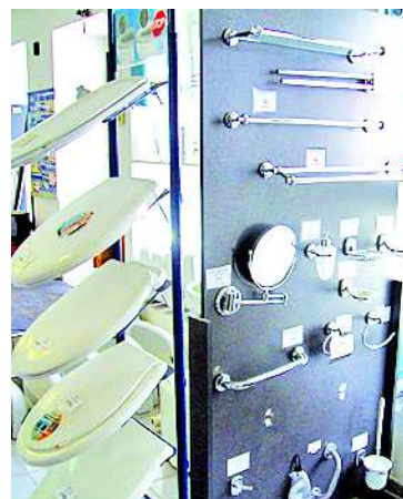
Egyes fürdőszobafelszerelések is akciós áron kaphatók

A Szigma Komfort a Salgó tűzhelyek és kályhák székszárdi márkaképviselete, de széles választékban találhatók az üzletben Hajdú vízmelegítők, és a MOFÉM csaptelepeinek teljes szortimentjével, udvarias kiszolgálással és tanácsadással várják a vásárlókat. Aki teljes fürdőszoba-felújítást tervez, az is számíthat a cég segítségé-