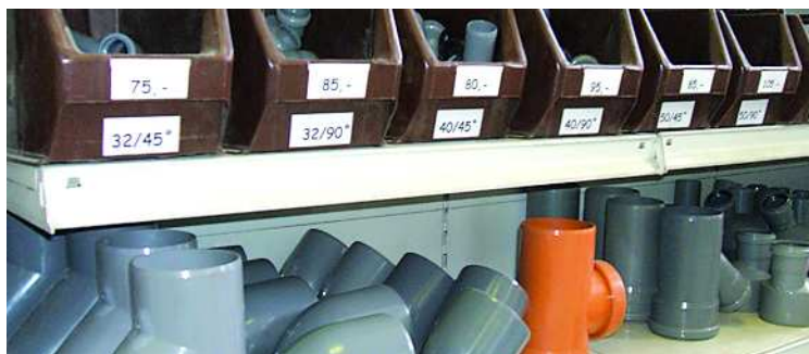
Minden PVC-idomra 10% kedvezményt adnak április 24-ig