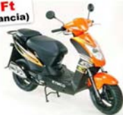
KYMCO ACILITY 50 4T

Ismét 2008-as áron 269.000 Ft (36 hónap garancia)