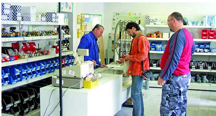
Udvarias kiszolgálással, tanácsadással várják a vásárlókat