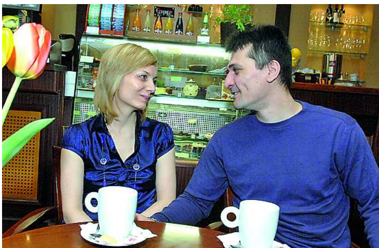
Egykori profi táncosként a jövő táncosait tanítgatják