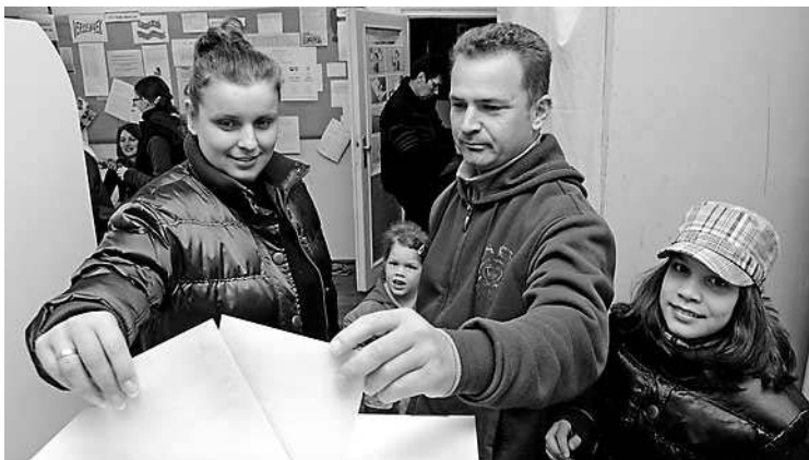
A Nagy család felnőtt tagjai adják le szavazatukat a Garay iskolában

Tolna megyében a Fidesz-KDNP lépte a mezőnyet. Valamennyi egyéni jelöltjük az első fordulóban megváltotta belépőjegyét az ország házába. Ez azt jelenti, hogy Horváth István (Szekszárd és körzete), Tóth Ferenc (Paks és körzete), Potápi Árpád (Bonyhád és körzete), Patay Vilmos (Dombóvár és körzete), valamint Hirt Ferenc (Tamási és körzete) négy esztendőre felhatalmazást kapott a választópolgároktól. Ez a teljesítmény eddig egyedülállóan számít, hiszen a megyében a korábbi országgyűlési választásokon még nem fordult elő, hogy egyetlen párt valamennyi jelölt-