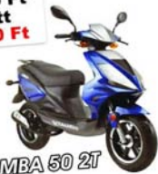
TAURIS SAMBA 50 2T

Ismét 2008-as áron 269.000 Ft (36 hónap garancia)