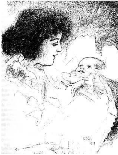
Csók (Csók István rajza a Garay albumban)

A híres adomagyűjtő, Gracza György a legendás anyai (s atyai) szeretetről évődik. „Ambrus bácsi, aki már megunta jogász fiának folytonos zsarolását, a korhely fiú egyik pénzkérő levelére így válaszolt: „Édes fiam! Azt a levelet, a melyben megint pénzt kértél, nem kaptam meg. Hiába is kérnél, mert többet úgy sem adok. Édes anyád azonban az én hírem és tudtom nélkül itt küld ötven forintot. Apád.”