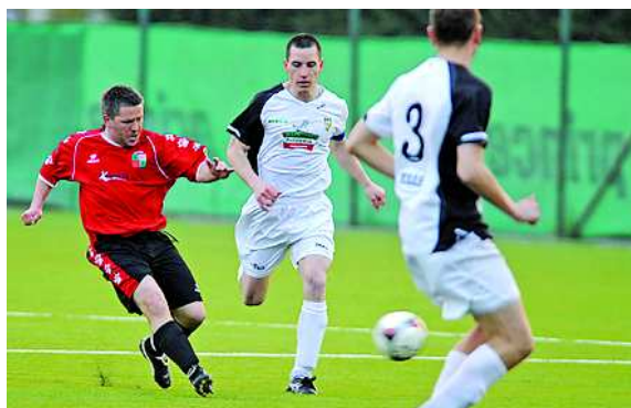
A Tolle UFC már bajnokit is játszott a műfüvön

– Az ár egyelőre megegyezése kérdése, és bizonyos szempontok mellett a későbbiek során is az lesz – jegyezte meg előljáróban a klub elnöke, aki a kispályás bajnokság nevezőinek reklamációival kapcsolatosan megegyezte: nem tudni, hogy a fentebb említett baranyai településeken milyen szolgáltatás húzódik meg az árak mögött, ki és milyen feltételekkel, támogatással üzemeltet, mert ez is lényeges az ár megítélésénél.