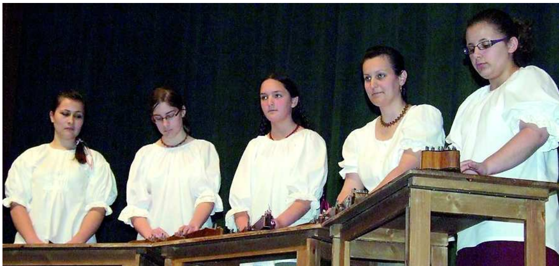
A II. korcsoportban 3. helyezett paksi Kalinkó citerazenekar