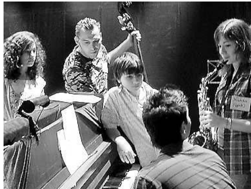
Zeneszó kísérté az előadást

Magyarul, az Utópia öt sorának kivételével kezdődött az emlékműsor, amely minden oldaláról bemutatta a szederkényi születésű magyarországi német író, költő, műfor-