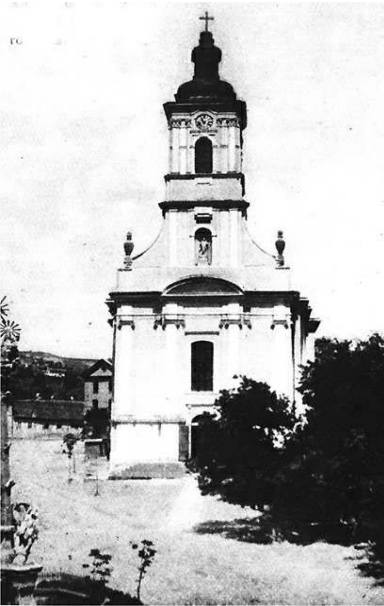
A belvárosi templom az 1925-ben leégett zömök barokk toronnyal