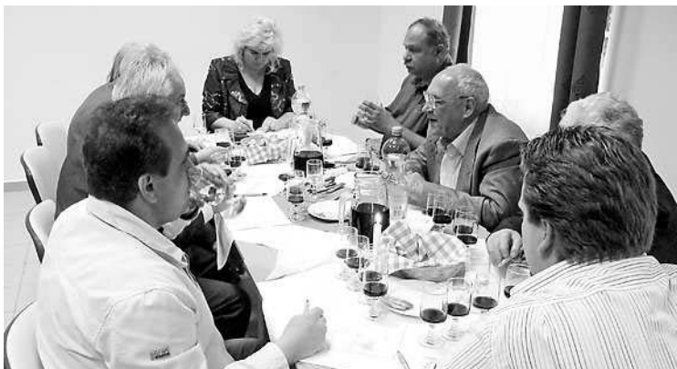
Szakértő zsűri bírálta a borversenyre benevezett mintákat