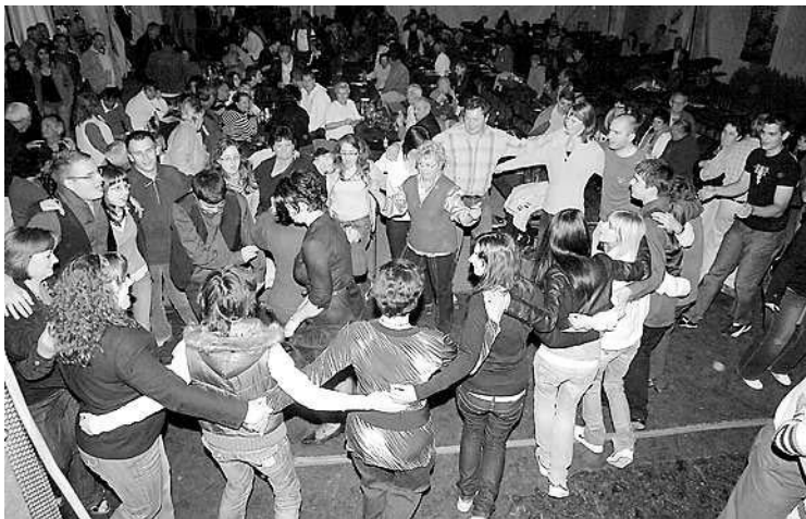
Tánc a fesztiválsátorban: a jó kedv garantált

A pümkösi rendezvény ünnepi megnyitójára 21-én 18 órakor kerül sor a mintegy száz méter hosszúságú fesztiválsátorban, ami a központtól az Arany János utca sarkáig ér majd, tud-