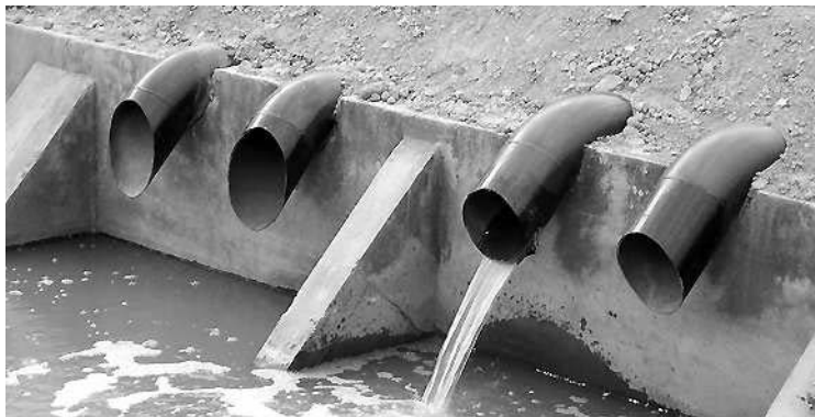
Immár hat szivattyú segíti a vízátemelést a záportározóba

■ Szekszárdon – a város domborzati viszonyai miatt – állandó problémát okoz a jelentősebb mennyiségű, záporjellegű csapadékhullás. Az önkormányzat az ebből adódó vízkárok elhárítására programot dolgozott ki a csapadékvíz és felszín alatti vizek elvezetésének megoldására: a Magura patakon záportározó kiépítése. A projekt hatása – az óriási vízgyűjtő terület miatt – a me-