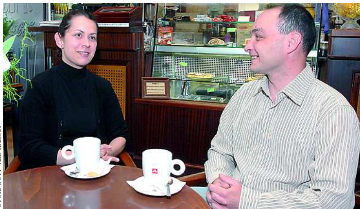
Nem az anyagi megbecsülés motiválja őket munkájukban

– A legjobb felüldülést számomra a jógázás jelenti. Csoportban s otthon egyedül is jógázom. Családi házban lakom, ahol a szívem csücske egy kis tó, s benne az aranyhalaim. A velük való foglalatosság kellemes időtöltés és kapcsolódás számomra.