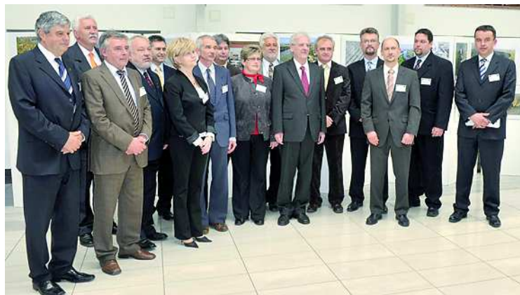
Sólyom László köztársasági elnök klímabarát települések vezetőivel

Horváth István polgármester „Székszárd a jövő városa” címmel tartott előadást, és mutatta be az önkormányzat eddigi és tervezett klímavédelmi programjait, akcióit, a résztvevő mintegy 80 fő számára. Az idő rövidsége