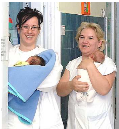
Babák és nővérek: értük van a rendszer

akkor öröm, amikor ilyen önzetlen segítőkészséget tapasztalnak.