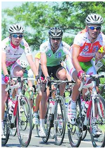
Idén is nyeregbe pattannak?

A megye és a város változatlanul akarja a nagydíjat, de nem a tízmilliókat, hanem olyat, amit akár kettőből is tető alá lehet hozni, amelyben jelképek a pénzdíjak, amelyben a magyar klubok dominálnak, s persze mutató-