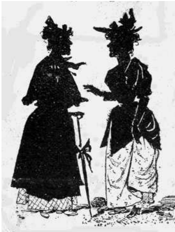
Befeketített asszonyok (Jeney Jenő rajza)

„Templomi botrány volt múlt szombaton. Az egyik káplán, kinek Szent János szobránál esti litániát kellett volna tartani, az esős idő miatt a templomban tartotta azt. Emiatt a litánia után néhány durva asszony megtámadta a káplánt, kit a támadás nagyon érzékenyen bántott, egyik feléje közeledő asszonyt ellökte magától, mire valami hitvány kiszolgált csizmadiamester, ki a papokat – mint mondani szokta – nagyon kordában tartja, mert már régóta templomszolgának készül, durva sértésekkel illetve a papot, oly cifra káromkodások ki-