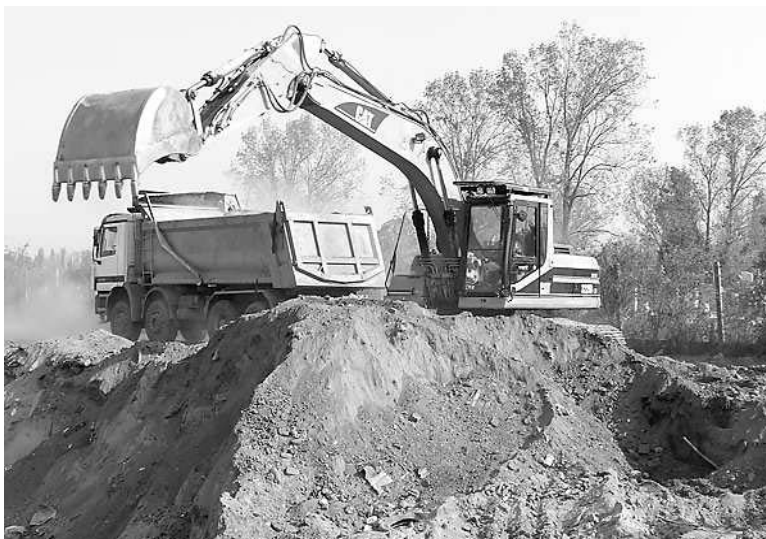
Megkezdődhet a szemételepek rekultivációja

Elvégzik a szelektíven gyűjtött hulladék válogatását. Ellátja a mintegy 70 ezres régió komposztálási feladatait. Legalább húsz évre elegendő a lerakó kapacitás, ha jelentősen nő a szelektív gyűjtés, akkor lényegesen tovább. Mindez azt jelenti, hogy durván évi 70 ezer tonna a lerakó kapacitás, s tízezer tonna szelektíven gyűjtött hulladék válogatására alkalmas a hulladékkezelő központ.