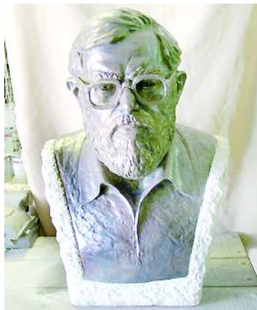
Baka István költő portréja