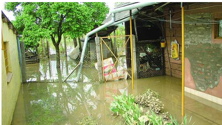
Sok családban egy élet munkáját tette tönkre az árvíz