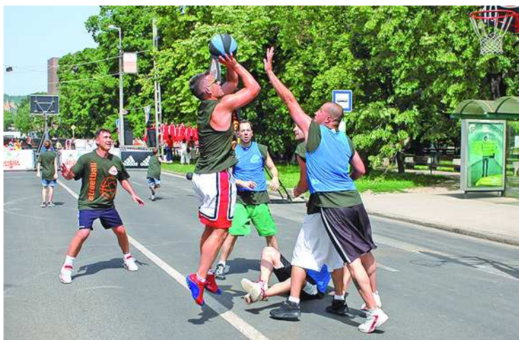
A hősséggel is dacoltak az utcai kosárlabda szerelmesei