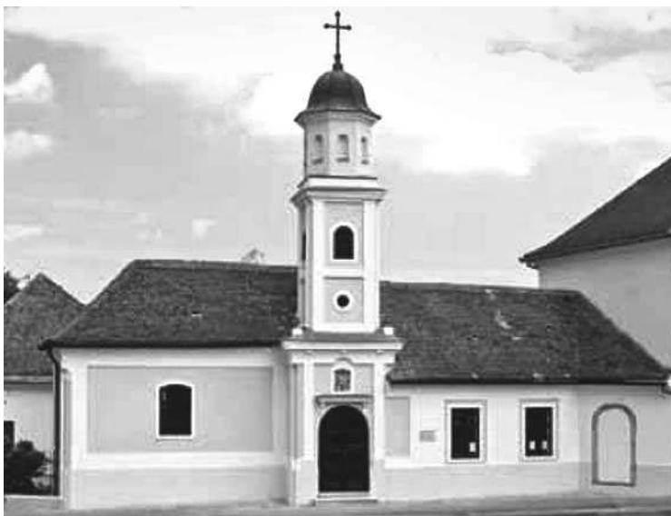
A 250. évfordulóra szépen felújították a kápolnát

A Szekszárd-Alsóvárosi Római Katolikus Közhasznú Egyesület és a Szekszárdi Római Katolikus Egyházközség tisztelettel meghívja Önt, hozzátartozóit, ismerőseit 2010. június 25-én 18.30 órára a felújított Szent János és Pál kápolna megáldására, amely egyben a szekszárdi Szent László napok ünnepélyes megnyitója is.