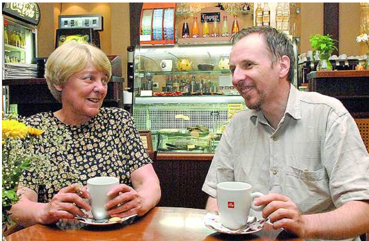
Mindketten régóta megbecsült alakjai a megyei újságírásnak

– Olvasok. Újságot, regényt, tényirodalmat, internetet. Szeretem a zenét, az opera a kedvencem. Van néhány barátom, akikkel sokkal többet kellene együtt lennünk, mert lassan kifutunk az időből... Szerencsére nagy a családom, a lányomékkal havonta egy hétvégét töltünk együtt. Az anyukám 82 éves, és van három testvérem, meg öt unokaöccsem és -húgom. Ha tízszer ennyi időm lenne, akkor sem unatkoznék. Ha pénzem lenne, akkor meg utaznék.