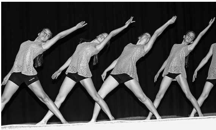
A Gyakorló iskola tánctagozatának növendékei