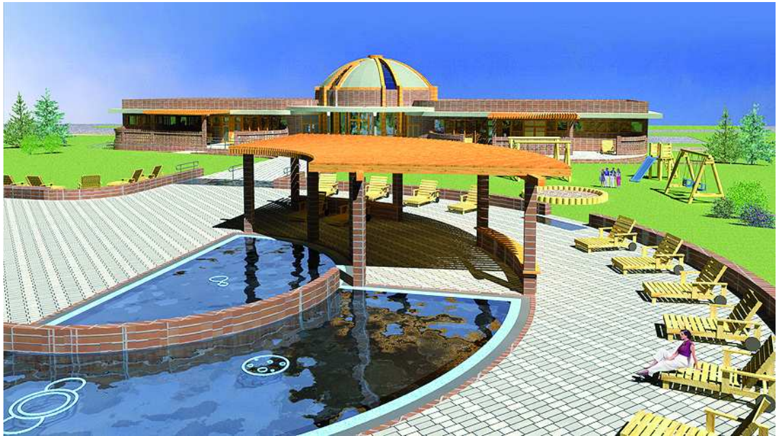
A szabadtéri élményfürdő gyermekmedencéi, háttérben a fogadóépülettel és a játszótérrel

- Megkötött támogatási szerződéssel rendelkezünk, és pályázatunk a minőségbiztosítási követelményeknek is maradéktalanul megfelelt. Várjuk a pozitív döntést, amit követően