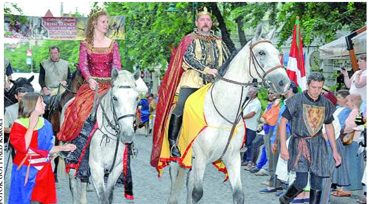
Hagyományosan lovon érkezett a királyi pár