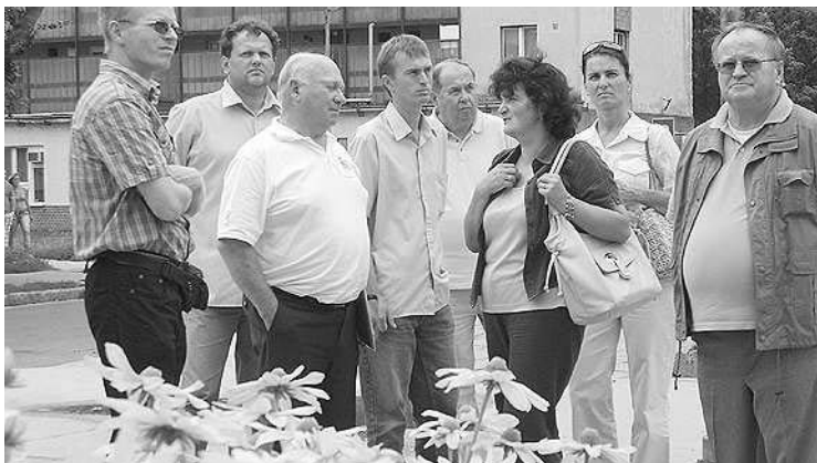
A bejárás során a 160 lakásos előtti téren is elidőzött a zsűri