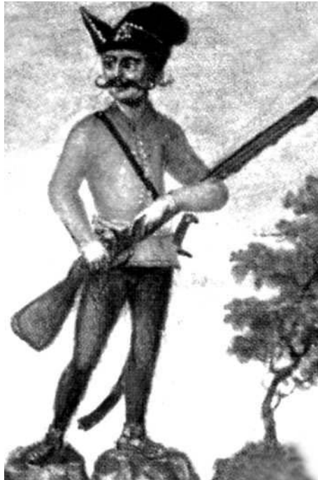
Tanácstalan kuruc a Cseri János utcában (valójában részlet Esze Tamás nemesi címeréből)

szavazásaik végén nem teljesen átgondoltan hoztak döntést. Így jött elő Cseri János neve. Valójában Apácai Csere Jánosnak hívták, a XVII. század legnagyobb gondolkodója volt, filozófus, pedagógus, a magyar irodalom története tíz oldalon beszél róla. Az utca névadásának idején jelent meg több munkája is új kiadásban, s valahogy valakinek a fejében megra-