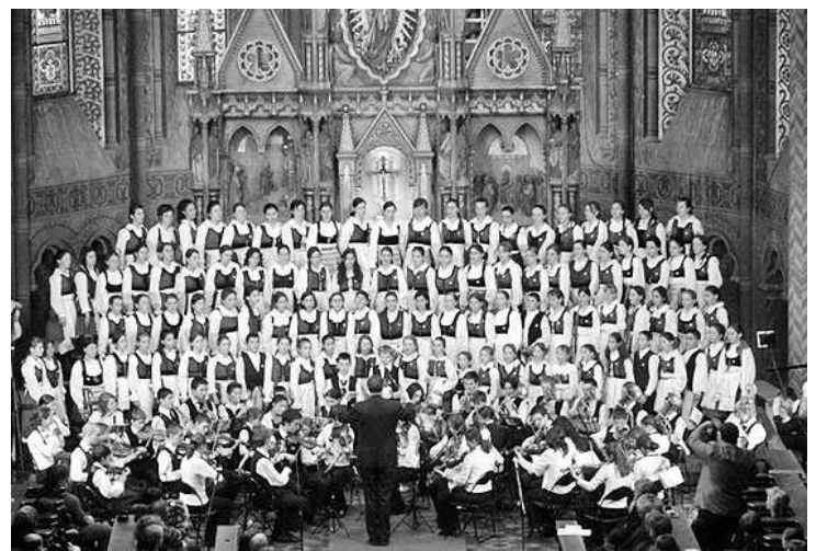
A kórus a Mátyás templomban is fellépett