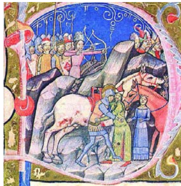
Szent László a krónikában