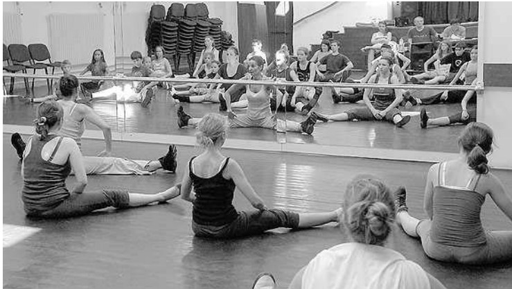
Próba a táncteremben

- Az nem kifejezés, hogy fárasztó, és örületes a meleg - mondja boldog mosollyal egy a próbáról kijövő, már több színpadi sikert megért fiú. Úgyhogy siet is ki a szabad levegőre. A gyerekek csoportjában egy lány várakozással teli örömmel, kezében a szerepét szorongatva sorolja a feladatokat: először a muzsika hangjából egy húszperces koreográfiát próbálnak, aztán a Mama Miából összeállított tizenhét perces, a Szegény gazdagok három jelenetét, zárásként pedig a Hairsprayt (Hajlakk). Mindeközben magánéneket, táncot és beszédtechnikát tanulnak egyéni foglalkozásokon, kórust, koreográfiát és színpadi mozgást csoportosan.