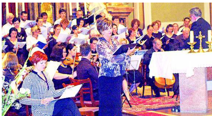
Haydn: Missa Cellensis – koncert a belvárosi templomban