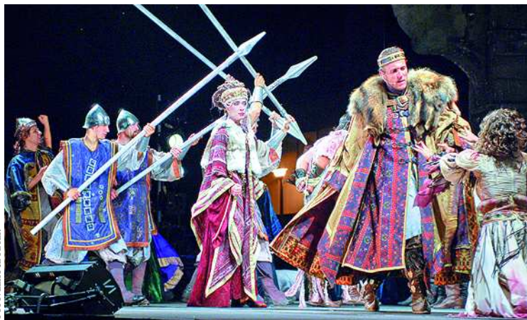
Látványos, magas színvonalú produkcióval rukkolt ki a Társulat

Három éve Székszárdon még az eredeti főszereplők, Varga Miklós (Ist-