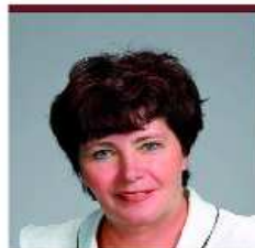
HALMAI GABORNÉ VIII. sz. VÁLASZTÓKERÜLET