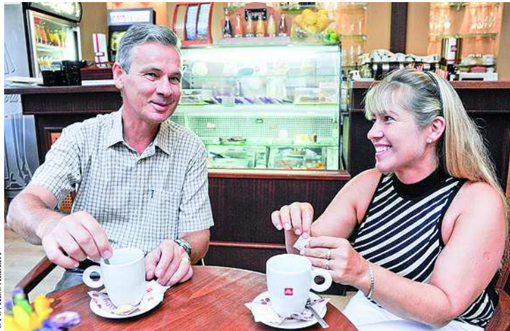
A kerékpár nyergében is otthonosan érzik magukat

– Ez egy baráti társaság, s valóban nemcsak a túrára „szerveződött”. Összejövünk más alkalmakkor is: együtt szilveszterezünk, név- és születésnapozunk. A „Bobita” rövidítés „adta” magát, ugyanis „Borkedvelő biciklisek tánccsapata” a teljes nevünk. Mindhárom elfoglaltság kedvence a csapatnak, de úgy gondolom a legfontosabb a barátság, az együttlét, az élmények gyűjtése. Miután fotós is van közöttünk, a túrán, egyéb összejöveteleken történt kedves, kellemes, vicces események megörökítésre kerülnek, amit aztán nagy örömmel nézünk vissza, s éljük át megint a hangulatos, élménydús eseményeket.