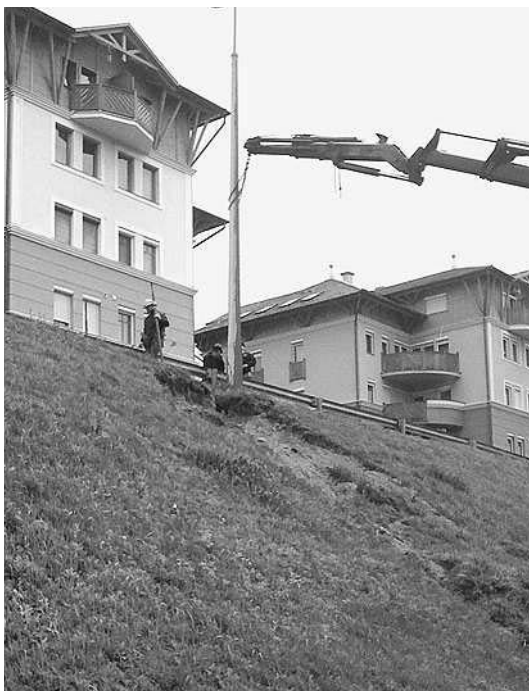
A Csalogány utcai megcsúszás miatt ki kellett venni a veszélyesen megdőlt villanyoszlopokat

méter is hullott. Mivel a város domboldalát lösz alkotja, földcsuszamlások, pincebeszakadások is voltak. Vismajor-pályázatot a közterületeken, önkormányzati tulajdonban lévő létesítményekben keletkezett károkra lehet beadni. A bizottság javaslatait a közgyűlés egyhangúlag elfogadta.