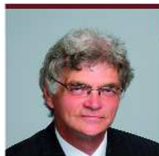
ÓSZE JÓZSEF II. sz. VÁLASZTÓKERÜLET