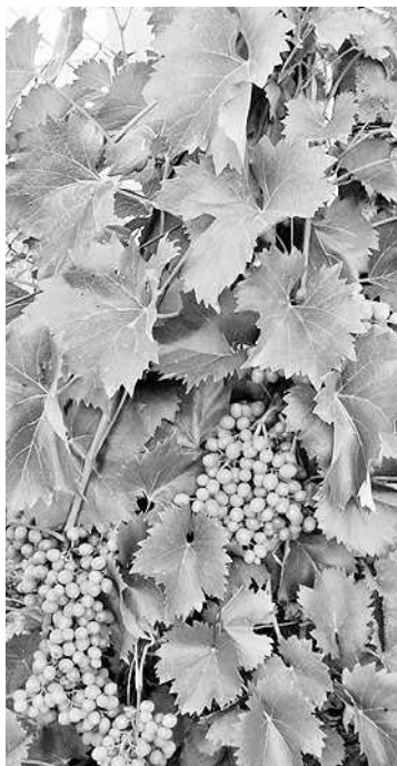
A minőségről az ősz dönt

– Így igaz. Két-három napos csúszás már – ahogy azt a kísérleti táblákon tapasztaltam – komoly fertőzé-