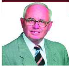
TÓTHI JÁNOS V. sz. VÁLASZTÓKERÜLET