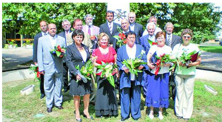
Csoportkép: az idei kitüntettek a Szent István-szobor előtt