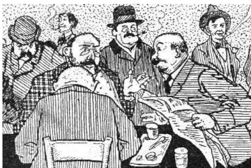
Az újság és olvasói (Cserna Károly rajza)

készíteni?! Azt írjam le, hogy Huberné minék nevezte Zapflnét, vagy hogy Bogár Jancsi miként ütötte föbe Piros Pistát?! – Kérem alásan, nem várhatok, mert különben a lap nem jelenhetik meg kellő időben! – Csak egy kis türelmet, majd tudakozódok valahol valami tárgy után. – Hanem holnap reggelig megkapom? – Meglesz. S a tárcáíró elindul tárgyat keresni. – Nem tudsz valami újságot, pajtás? – Neked nem tudok, mert ti már belenyúltok a családi élet szentélyébe. Nem akarok semmit tudni rólatok. – Servus! Menjünk tovább, tán itt szerencsésebbek leszünk. – Kérem, nem fordult itt elő valami tárcacikkre alkalmas tárgy? – Igen is, nem, mert az urak mindenre képesek, még a denuntiációra (besúgásra) is. – Alázatos szolgája! Talán majd itt lesz. – Nincs semmi közlendője? – Nincs! Ha engem betesznek az újságba, megpál-cázom az urakat! – Mintha ez is megtagadná. Végigmegy az utcán, minden elfordul tőle, a füleivel hallja, midőn a mellette elmenő azt súgja a másiknak: most ne tégy semmit, mert beletesznek az újságba.”