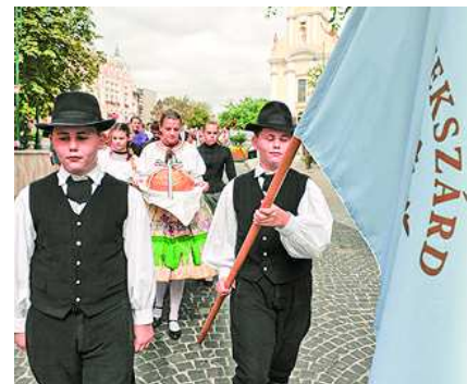
Menet kísérté az új kenyéret