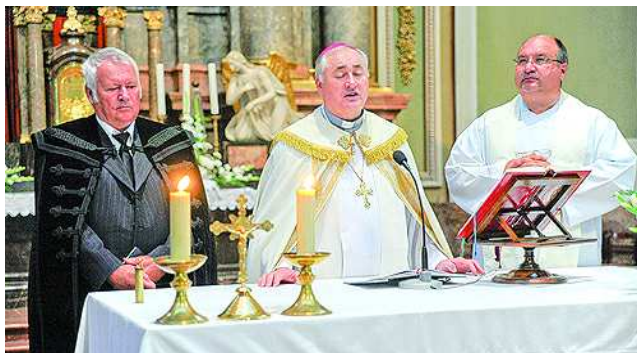
Ökumenikus áldással zárult az ünnepi szentmise