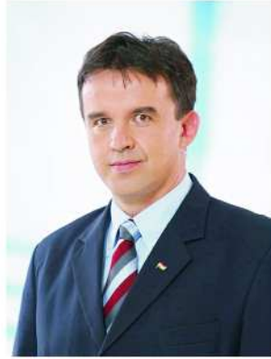
HORVÁTH ISTVÁN az Ön polgármesterjelöltje