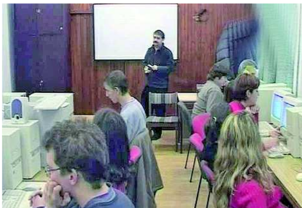
Informatikai képzés heti 8 nyelvórával

- Igen, a rendes időben elkezdtük a tanévet, de a turizmus és az informatika területek iránt érdeklődők folyamatosan csatlakozhatnak. Várjuk azokat, akiket nem vettek fel egyetemre, főiskolára és szeretnék hasznosan eltölteni az időt a következő felvételiig, vagy azokat, akik nem akarnak négy-öt évet tanulni, de mégis szeretnének szakmát szerezni. Mind a turizmus, mind az informatikai képzés is heti 8 nyelvórát tartalmaz. A diákok angol és német nyelv közül választhatnak. A cél a nyelvvizsgára való felkészítés, illetve a megfelelő szintű szakmai nyelv elsajátítása. A nyelvvizsgát a diákok itt az iskolában