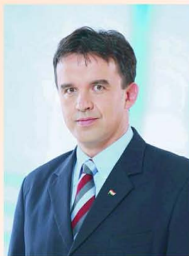
HORVÁTH ISTVÁN az Ön polgármesterjelöltje