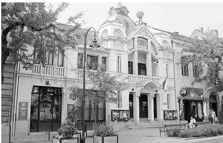
Gazdag programot, tartalmas szórakozást ígér a német színház

A DBU új évadjának első egész estés előadása Carlo Goldoni: Mirandolina című vígjátékának háromnyelvű adaptá-