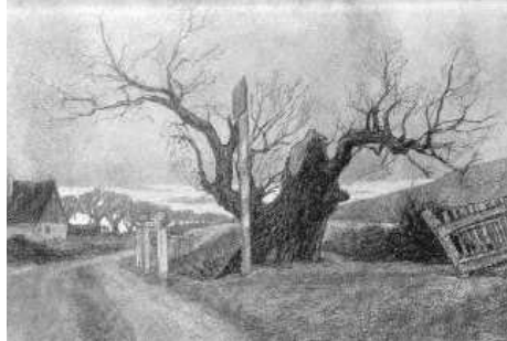
A Balogh-fa – negyven évvel kettétörte után (Miklósi Ödön rajza)

A következő hónapban megírták: „egy Tolna megyei származású buzgó tagtársunk csodálkozását fejezi ki, holott értesülése szerint indítványunk a vármegyének még october havi bizottmányi gyűlésén fölolvastatott, s lelkesülve fogadtatván, azonnal bizottság neveztetett ki az indítvány foganatosítása érdekében teendő intézkedések végett.” A lelkes válasszal együtt tudatták azt is: „biztos értesülés szerint e választirat az ottani kiadóhivatal túlhalmozottságából eredett tévedésből késett ily soká”. De ezenkívül nem történt semmi.