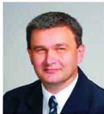
Ács Rezső III. számú választókerület

2010. szeptember 27-én (hétfőn) 18 órára Fidesz Iroda fsz. nagyterem (Szekszárd, Hunyadi u. 4.)