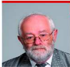
MARTIN JÁNOS III. sz. VÁLASZTÓKERÜLET