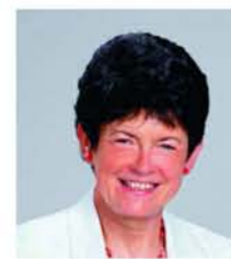
Lemle Béláné VII. számú választókerület