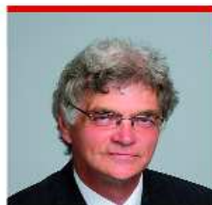
ÓSZE JÓZSEF II. sz. VÁLASZTÓKERÜLET