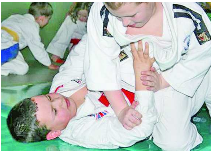
„Nem elég földre vinni, ott is kell tartani az ellenfelet”

Volt az ifi korosztályban is szekszárdi résztvevője a horvátországi világver-