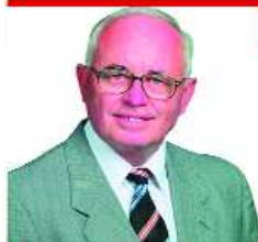
TÓTHI JÁNOS V. sz. VÁLASZTÓKERÜLET