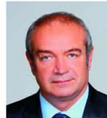
Fajsz Lajos X. számú választókerület

2010. szeptember 29-én (szerdán) 18 órára Római Katolikus Plébánia Közösségi Ház (Béla király tér 9.)