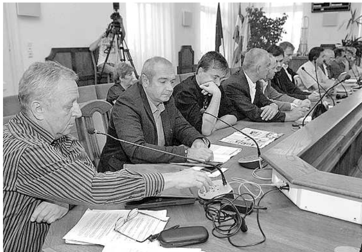
Munkában a Fidesz-frakció képviselői

Az elnevezés alapja az a legenda, miszerint a hadaival erre vonuló király kardját a domboldalon a földbe szúrta, s ennek nyomán forrás fakadt. A közgyűlés megköszönte a Csurgó megújulását támogatók hozzájárulását. Ugyancsak vita nélkül ment át a költségvetés féléves teljesítéséről szóló előterjesztés, bár az ellenzék szavazatával nem támogatta. Elfogadta a képviselő-testület a gazdasági bizottság javaslatát több külterületi ingatlan eladásáról, s döntöttek arról is, hogy a bizottságok javaslati alapján az önkormányzat 15 alapítványt támogat összesen 1,663 millió forinttal. Az alapítványok közül a Szekszárdi Röntgenalápitvány mobil betegszállító kocsit beszerzéséhez kapott 200 ezer forintot támogatást. Saját keretéből a szociális bizottság a Peter Cerny-alapítványt, míg a gazdasági bizottság a Zöldtárs Alapítványt támogatta.