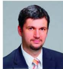
Dr. Hadházy Ákos IX. számú választókerület