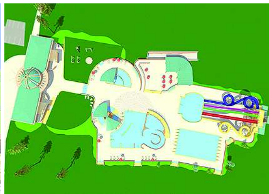
A második ütemben fedett termálfürdő, a harmadikban új sportszoda