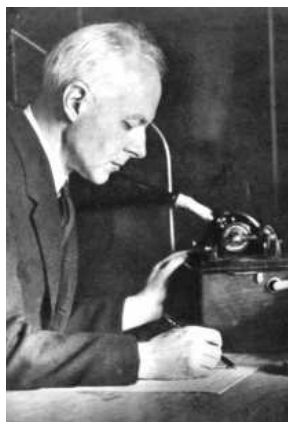
Bartók Béla a fonográfál

Az idő játéka, hogy háromnegyed évszázad múltán összekapcsolható Liszt és Bartók neve, ráadásul több-kevesebb nyomot mindketten hagytak megyeszékhelyünkön.