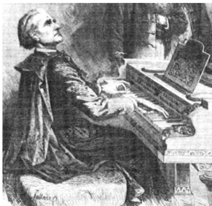
Liszt szegszárdi zongoránál 1870-ben (részlet Franz Kollartz rajzából)