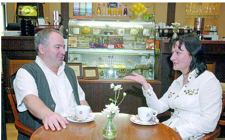
A spanyol költő, Lorca versei is összekötik őket

- Napközben az I. Béla gimnázium egyik iskolatitkára vagyok, délután 4 után magánórát, tanfolyamok keretében német nyelvet tanítok, utána és hétfőgőn szakfordítóként dolgozom, a német nyelv iránt érdeklődőknek honlapot szerkesztek, illetve hogy az élet-hosszig tartó tanulás fontosságáról ne csak másoknak meséljek, jövő héten kezdem a Pécsi Tudományegyetem tanár-könyvtárpedagógia-tanár szakát. Mindezek mellett nagyon jó egy kicsit mással is foglalkozni, így például nagy öröm számomra, amikor együtt lehetek a gitárkvartettel, akik nemcsak „munkatársaim”, de barátaim is.