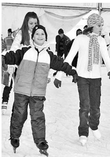
Évek óta népszerű a korcsolyázás

A tervek szerint 2010. november 27-re, szombatra már olyan minőségű jeget hizlalnak, ami nem adhat okot panaszra. A nyitás tervezett napja tehát november 27., amikor bárki ingyen kipróbálhatja a pályát. A létesítmény üzemeltetését idén is a Szekszárdi Víz és Csatornamű Kft. végzi. A belépőjegy ára a tavalyihoz képest nem változik, ebben a szezonban is 600 Ft lesz, s a kísérőjegyek ára szintén a tavalyi szinten marad (300 Ft). Érdemes lesz bérletet váltani, a bérlet