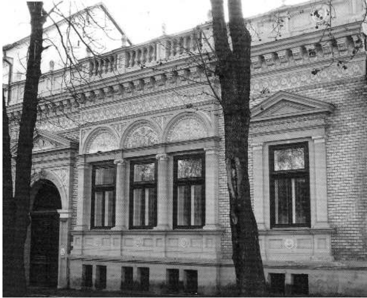
A költő-újságíró egykori lakóháza a Bezerédj utcában

sabbak-e helytörténeti munkái és szerkesztései. A szegszárdi takarékpénztár ötvenéves története 1896-ban, Garay-album a költő emlékszo- rának leleplezésére jelent meg 1898-ban. A Gárdonyi Alberttel közösen írt kétkötetes Bezerédj István életrajz 1918-1920-ból máig megejtő a- laposággal sejteti, miért adta ki az Akadémia, s miért nyerte el Csapó Vilmos e célra kifizetett díját. A Tolna vármegyei közművelődési egyesület év- könyve 1913-ból, a Szabadsághar- cunk ozorai diadala 1937-ből, a Béri Balogh Ádám, a vértanúhalált halt kuruc brigadéros 1940-ből, a Bezerédj István és a százéves Szegszárdi Kaszinó 1942-ből jelzi sokoldalúságát. A