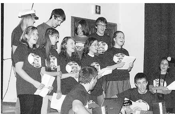
A Fazekas Mihály Gimnázium diákjai