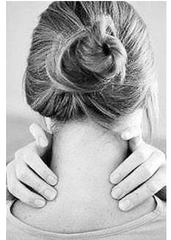
Gyakori panasz a nyakfájás is

korban jönnek elő, s 50-60 éves korra már általánossá válhatnak. Igen nagy fájdalmak származhatnak egy-egy rossz mozdulatból, túlerőltetésből, vagy akár egy egyszerű influenza szövődményeként. A porckopás a csípő, a térdízületet és a hüvelykujj alatti részt is érintheti. Mint a főorvos elmondta, a kezeket érintő ízületi gyulladás az ujjakon a középső nyolc bűtyöksort érint, a két hüvelykujjánál inkább porckopás jellemző. Röntgenen át – tette hozzá – nem észrevehető a porc, ugyanakkor a felvételen, ha a két csont láthatóan közel kerül egymáshoz, tudható: kevés a porc közöttük. A csontritkulás következménye csigolya-összeroppanás is lehet, az eltorzult gerinc tartáshibákra vezethető vissza.