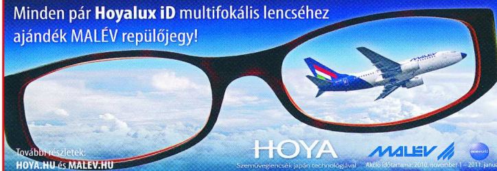
Továbbértékeltek: HOYA.HU és MALEV.HU

Minden pár Hoyalux iD multifokális lencsééhez ajándék MALEV repülőjegy!