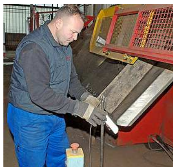
Format 12 kengyelhajlító automata segíti a dolgozók munkáját

- A Dél-Dunántúl és Bács megye a Vertikál Kft. elsődleges működési területe. Betonacél gyártás-szerelésben a szakmában előforduló minden típusú lakó-, ipari és mezőgazdasági létesítmény vasalását készítettük már. Referenciáink között szerepel a szekszárdi Duna-híd pályalemeze és az M9-M6 bizonyos műtárgyai éppúgy, mint a paksi Erzsébet Szálló, a siklósi várfürdő, a Takler Pince bővítése vagy a kecskeméti 3 Gúnár Hotel betonacél-gyártása.