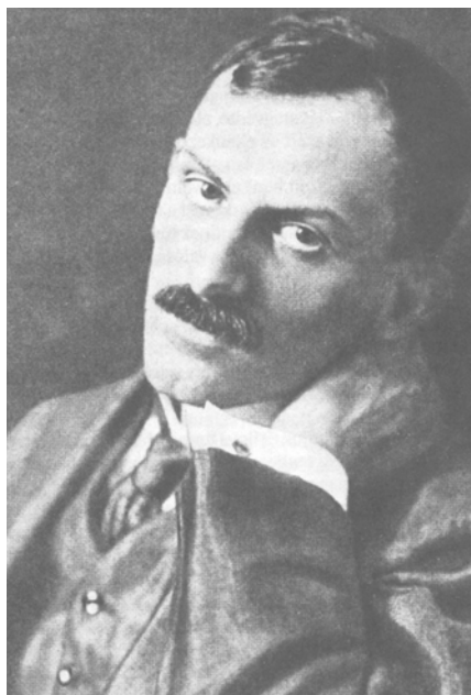
Babits A vihar fordítása idején

alatt elolvasni sem lehetne néhány oldal alkotóit. Valóságos irodalomtörténet beszédbeli említéssel és személyes jelenléttel Basch Lóránttól Weöres Sándorig, akit szelíden dorgál: „Te is hajlamos vagy túlbecsülni és óriás perspektívába állítani, amit éppen olvasol.” Aztán egy bölcsesség a sok közül: „Az igazi mondanivaló nem filozófiai.”