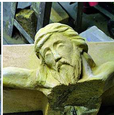
Ilyen volt és ilyen lett...

nulói koszorúkat, csokrokat helyeznek el a keresztnél.