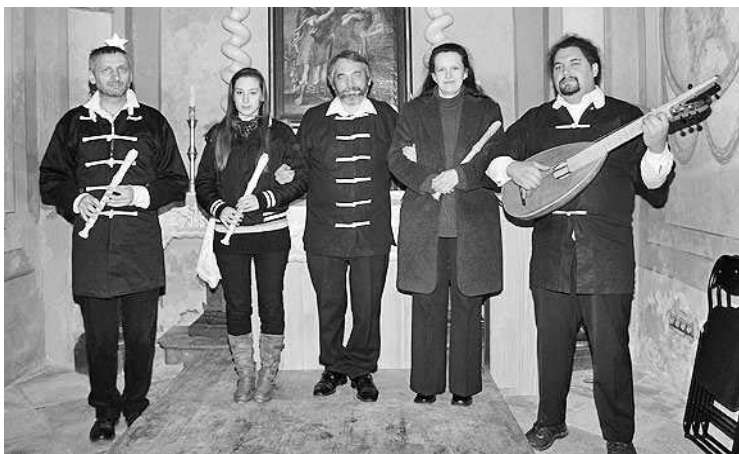
Az Ungaresca Consort szép műsorral kedveskedett az adakozóknak