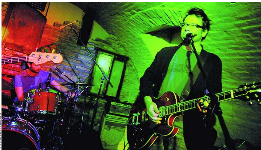
A népszerű zenekar decemberben a Szekszárdi Est Cafében lépett fel

– Úgy látom, hogy az előttünk levő generáció számos művészt bosszantja ez a díj, de nekem ez tetszik, szerintem ez kifejezetten szórakoztató. Egyébként szemtől szembe nyilván nem mondják, hiszen általában olyanokat kapok, hogy persze megérdemeltem, de azt nem tudom, hogy ők megkérdezték-e maguktól, hogy megérdemeltem-e. Valószínű, hogy azt mondják magukban, hogy nem, de nekem azt mondják, hogy igen. Megmondom őszintén, amikor kaptam egy értesítést arról, hogy lesz valami ilyesmi, eldöntöttem, hogy ezzel nem fogok foglalkozni, és rájöttem, hogy ez nagyon jó, mert feleslegesen okoztam magamnak kellemetlenséget korábban, számos alkalommal azzal, hogy elolvastam a lemezkritikát, meg a kommenteket, hogy például „ez már miért nem takarodik el...”, meg ilyeneket, és ez nagyon megviselt. Nemrég beszélgettem Kiss Tibivel a Quimbyből, egy közös Budapest Báros fellépésen, és láttam rajta, hogy nagyon szomorú. Azt mondta, hogy tényleg érdekelték ezek a dolgok az új lemezzel kapcsolatban, hiszen ezen dolgoztak hosszú ideig. Aztán megjelent egy kritika, ami olyan amilyen, de az a mocsoközön, ami utána zúdul, az nagyon ijesztő. Én meg azt mondtam neki, hogy a megoldás a következő: legközelebb elolvasod a