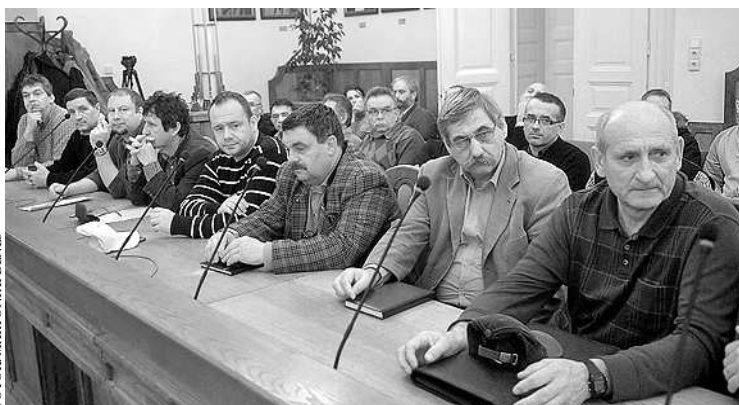
A találkozóra hetven vállalkozás kapott meghívást

Mint arról korábban beszámoltunk, a művelődési ház színházterme 21. századi világítási, hangosítási rendszerrel kap vadonatúj székekkel, míg a mozi helyisége sík padozatú, multifunkcionális teremmé változik, mely a legkülönbözőbb rendezvények igényeinek megfelelően alakíthatóvá válik. Alatta – egy emelet mélyen – öltözők, tárolóhelyiségek kapnak helyet. Két lift is lesz a házban, az emeletráépítéssel létrejövő új terek pedig nagyrendezvények, kóruspróbák, konferenciák lebonyolítását teszik majd lehetővé.