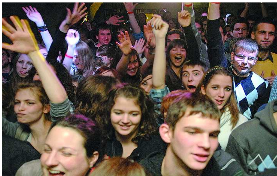
A szekszárdi fiatalok is jól ismerik Lovasi András zenekarát