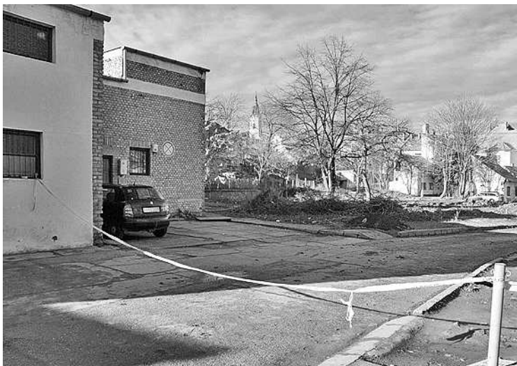
A munkaterületre a Bezerédj utca felől egyelőre tilos behajtani