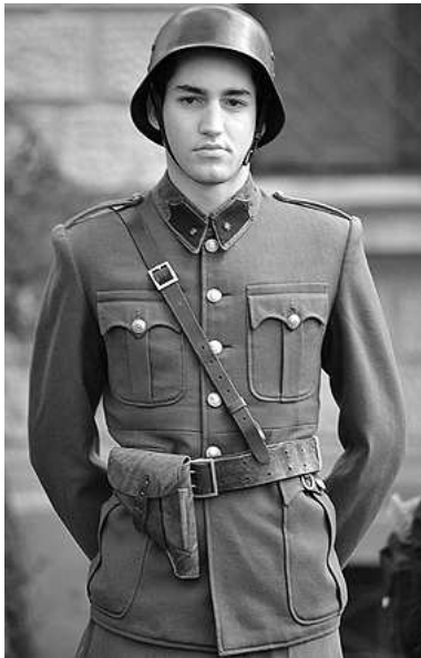
Ilyen fiatal fiúkat is harcban vittek a II. világháborúban