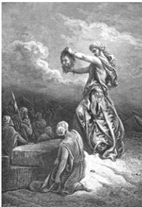
Judit felmutatja Holofernes fejét (Gustave Doré metszete)

ház őstörténete s szokásaiból, Szegszárd, 1852.; Örömhang Girk György pécsi püspök székfoglalására 1853. Szülővárosa remetekápolnájától megyéje számos apró részletét rejti a Falusi élet – Népies elbeszélések – Képek a közéletből című Pesten, 1856-ban megjelent két kötet. Igazi tevékenységét azonban sokkal szebben tükrözi az 1860-ban megjelent Betúlia