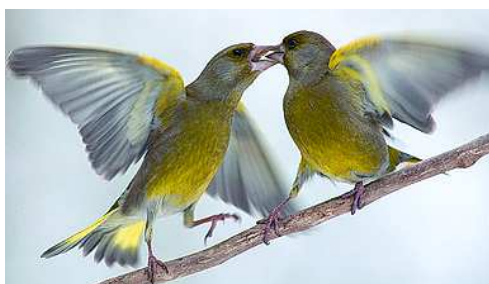
Két verekedő zöldike