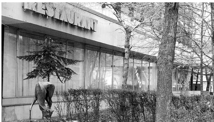
A földszinti étterem és presszó kirakatain öles betűk hirdetik: KIA DÓ