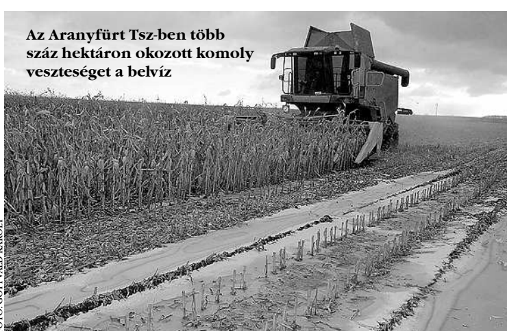
Az Aranyfűrt Tsz-ben több száz hektáron okozott komoly veszteséget a belvíz

– A „magyar monszun” kártékonyosságát bizonyára az őszi vetésekkor is el kellett szenvedniük.