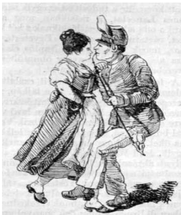
Falusi pár (Aggházy Gyula rajza)

cabaret a szekszárdi kaszinóban című 1911. január 2-án megjelent beszámolója szerint Kovács Lászlóé a szövegírás érdeme, az előadásé pedig a későbbi jeles színészé, Bodnár Jenőé. „Fő-utcának közepében / Áll egy sor deszka-palánk, / Az idegen megkérdi: / Ez vesszőtelep talán? / Vagy tán téglavetőház, / Vagy szemétkerakodó? / De a szekszárdi barátja / Büszkén kiáltja: ohó! / Ez, nézz jól oda: / Posta-palota, / Nem hiányzik más, te bárgyú, / Csak a lyuk körül az ágyú, / a többi két éve kész. / Posta-palota: Kincstári csoda!” Most már csak azt a csodát kellene megfeyteni, hogy a Szekszárd város történeti monográfiája 289. oldalán miért szerepel 1908-ban elkészült épületként „a Posta és Távirda (így)”? Igaz, ugyanitt említik az 1910-ben épült polgári leányiskolát is (Széchenyi u. 2.),