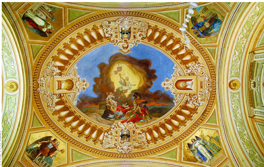
Az annak idején összefogásból felújított kupola most ismét veszélybe került

Sajnos arra a kérdésre, hogy az anyaországon kívülre rekedt négy katolikus „végvár” megőrkítésének nemmes gondolata kinek az ötlete volt, egyelőre nem sikerült választ találni.