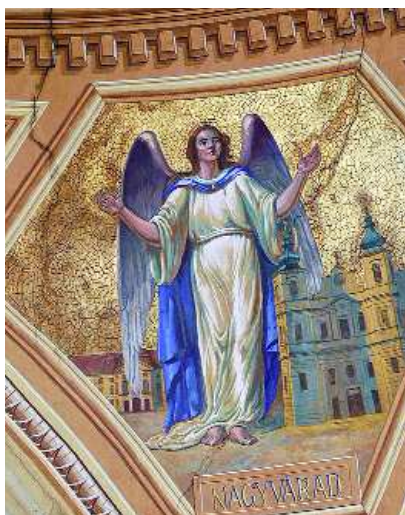
Repedések, vízfoltok a freskókon