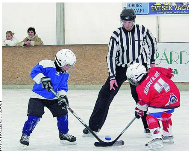
Gyerekek, felnőttek egyaránt komolyan vették a meccsüket