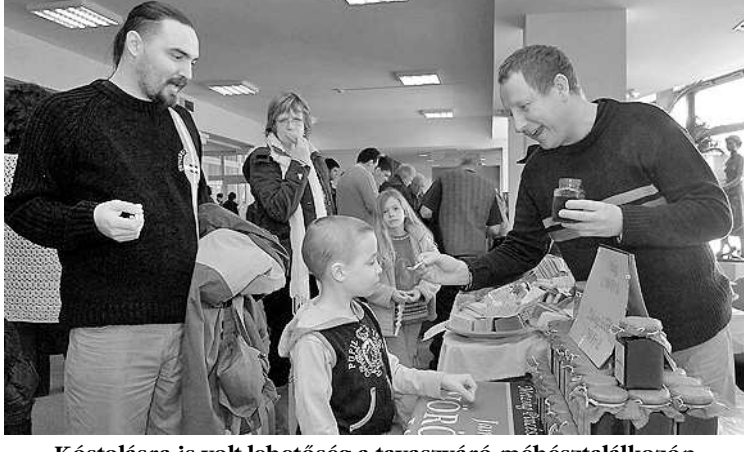
Kóstolásra is volt lehetőség a tavaszváró méhésztalálkozón

beszélünk. Nyilván van az egyesek között fajtán belül is különbség, ami az árakban ily módon megmutkozik, nem lehet(ne). S ennek jó példái vannak. Más európai országok méhészei is már korábban csatlakoztak hozzánk. Morvai Krisztina, a mezőgazdasági bizottságban dolgozó európai parlamenti képviselő támogatott abban, hogy az EP egyik anyagában már szerepeljen ez a védelem és az élelmiszerbiztonságot érintő probléma. Miképpen a természet hatása a biodiverzitásra, a tartható fejlődésre témakör is nyilvánvalóan már ebben az EP-anyagban az ágazat felkarolását remé-