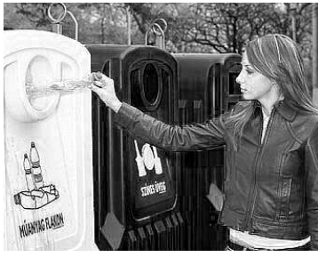
Egyre fontosabb lesz a szelektív gyűjtés (képünk illusztráció)

A heti minimális hulladékmennyiség – vagyis amire a szolgáltatóval szerződnie kell – az eddigi 140 literről 110 literre mérséklődik háztartásonként. Az egyedülálló nyugdíjasok esetében ez a szám a felére, azaz 70 literre csökken. Az ürítés gyakorisága a családi házas övezetben heti egy alkalomra mérséklődik. A társasházak esetében – közegészségügyi okok miatt minisztériumi rendelettel szabályozva – továbbra is heti kétszer ürítik a kukákat, sőt a 10 emeletes toronyházak esetében – azonos díj mellett – a heti háromszori szállítás tervezik bevezetni.