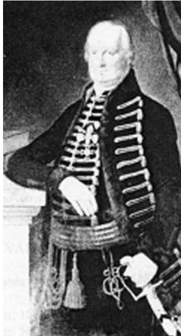
A főispán múzeumi arcképe... ... és családi címere (Nagy Iván könyvből)