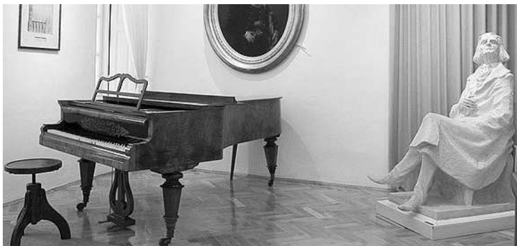
A vármegyei emlékszoba egy részlete. Liszt Ferenc hangszerét felújítják, és az októberi koncerten a tervek szerint meg is szólaltatják

vészeti egyetem növendéke. A szekszárdi program csúcspontja a már említett, október 18-i, vármegyei koncert lesz, melynek másnapján „Baka István: Szekszárdi Mise” címmel Orbán György előadói estjét hallgathatják meg az érdeklődők a német színházban. Október 20. és 22. között