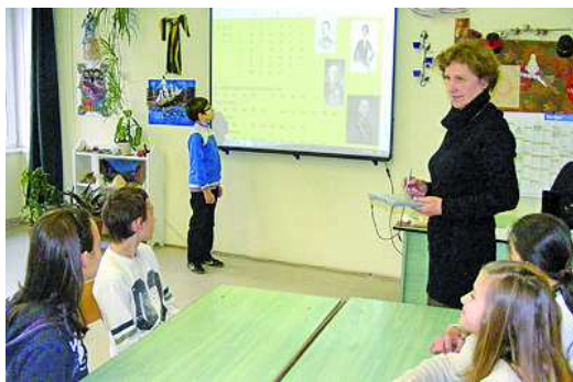
5. évfolyamos történelemóra interaktív táblával a Garay általános iskolában

– Mivel a pályázató cég eszközeit már eddig is alkalmaztuk iskolánkban, és a kiírás szerint interaktív anyagot kellett összeállítani – stílszerűen egy