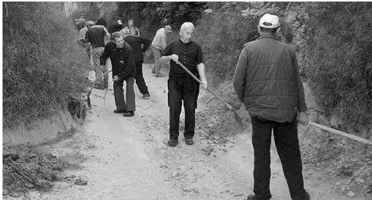
A völgy takarítását a gazdák maguk végezték, a föld elszállításáról az önkormányzat gondoskodik

Az idei első takarítást május 7-re szervezték meg. Reggel 7 és 8 óra között volt a gyülekező, gyönyörű, nap-sütötte idő fogadta a gazdákat. Közel 36 fő vett részt a munkálatokban. Levágták a benyúló gallyakat, lapátaikkal a mintegy 800 méter hosszú szaka-