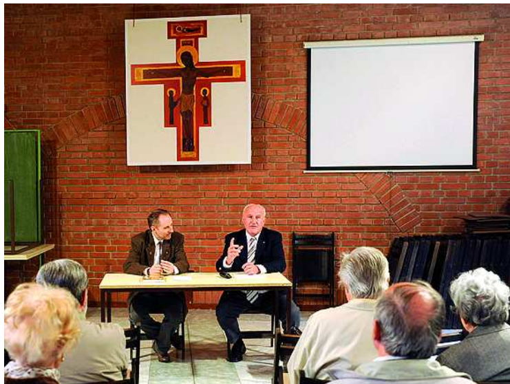
A neves sejtbiológus (jobbról) úgy véli, az élet hit nélkül, pusztán a tudomány eszközeivel felfoghatatlan