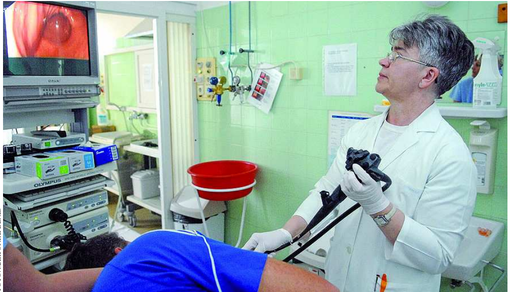
A főorvosnő gastroscopiás vizsgálattal állapítja meg, van-e káros elváltozás a beteg gyomrában

– Az alkohol és a dohányzás, valamint a nitritek bevitel (tartósítás) igazoltan kockázati tényezői a gyomorráknak, mint ahogy azt is megfigyelték, hogy a mélyhűtés ilyen szempontból kockázatosként elem. A tartósítás szempontjából a sózott, füstölt termékek nagyarányú fogyasztása kockázatot növel, a Japánban észlelt magas rákelőfordulást és halálozást is a sózott, füstölt halak fogyasztásával hozták összefüggésbe. Ugyanakkor az ún. antioxidánsokat nagyobb mennyiségben tartalmazó zöldek és gyümölcsök bőséges fogyasztása, nagyobb mennyiségű (napi 4 csésze!) zöld tea rendszeres ivása kockázatsökkentő lehet. A kockázatot növelő tényezők és hatásukra fellépő káros folyamatok a sejtek örökítő anyagában hozhatnak létre olyan genetikai változásokat, amelyek végeredménye a sejtek kontrollálatlan szaporodása, a daganatképződés. Nincs tudomásom róla, hogy táplálék-kiegészítők, amelyek sokféle és igen nagy számban beszerezhetők, a gyomor daganatos folyamatait kockázatot növelő módon befolyásolják. A dohányzás mellett a másik fontos tényező lehet a Helicobacter pylori