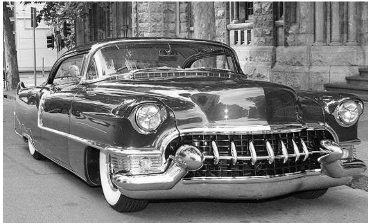
Cadillac Rex Bennetts 1955-ből

– Olyan ötletekkel és technikai felszereltséggel rendelkezik, melyeket még a mai autókban se mindenben találunk meg vagy csak nagyon drágán – mondja, és sorol is néhány példát: Az ő 1987-es évjáratú autójában például gombnyomásra felfújhatók és előre-hátra dönthetők az ülések, a hát-