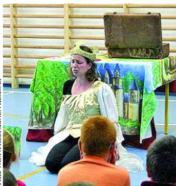
A KÉP NEM A HETSZÍNEN KÉSZÜLT