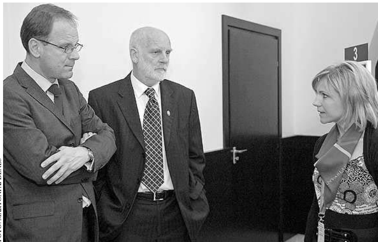
Navracsics Tibor (balról) és Tóth Ferenc felkereste a Garay téri kormányablakot is

Eszembe nem jut bárkit arra sarkallni, ha ideges és feszült, menjen be egy fél órácskára az alig öt hónapja nyílt ügyintézési helyre, a kormányablakba. Az viszont már most javasolt, hogy számos ügyet ott egy helyen elintézhettek az ügyfelek, ám ha egyelőre mégsem, akkor pontos felvilágosítást kapnak: mikor, hogyan és melyik hatósághoz kell fordulniuk. Szóval, ha itt Szekszárdon bemennek a Garay téri kormányablakba, valóban garantált a jó légkör, a készségesség – a ma már ritkaságszámba menő mosoly kíséretében. De tényleg! Én belestem a kormányablakba és hihetetlen kiegyensúlyozottságot, megértő hozzáállást tapasztaltam. Hasonlóan, mint a kijövő ügyfelek.