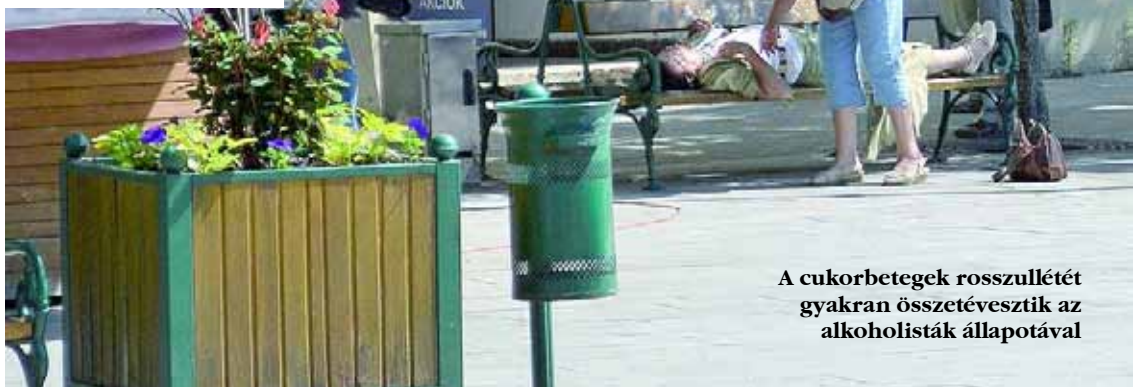
A cukorbetegnek rosszulletését gyakran összetévesztik az alkoholisták állapotával