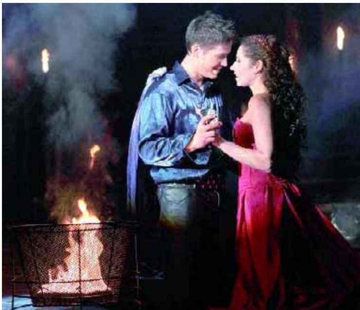
„Bukaresti Rómeó és Budapesti Júlia”

– A siker mögött sok munka van. Most jöttem meg Bukarestből, ahol a Rómeó és Júliát játszottuk két nyelven, magyarul és románul. A Rómeót alakító színész románul énekelt, ahogy a „családját” alakító énekesek is. Júliát én magyarul énekeltem, s az én „családomat” alakító kollégáim is. Óriási siker volt, telt ház, állva tapsolt a közönség. Azt éreztük, hogy ez az előadás egy nagyon szép kezdeményezés, s egy fontos momentuma, a magyar–román barátságának.