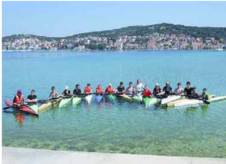
Edzőtáborozás Horvátországban idén áprilisban