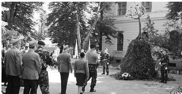
Tisztelgés a II. világháború áldozatai előtt