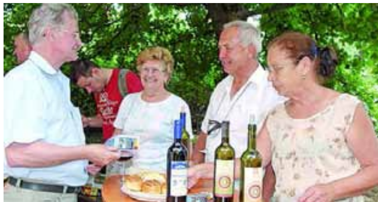
Nem csak zenéből, borokból is csemegézhetünk

Nyüzsgött a város azon a napon. Napsütéses boldogságban csókolózó párok, simogató árnyasok között tekertem biciklimmal a múzeumig.