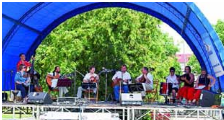
A színpadon a Szekszárdi Gitárkvartett és vendégzenészeik