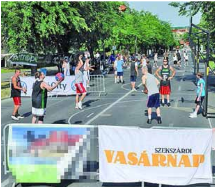
Tizenegy pályán pattogta a labda

ről, Bonyhádról, Bátaszékről, Dombóvárról, Székesfehérvárról, Tolnárról, Kecelről. A programot dobóversenyek és zsákolóverseny színesítette.