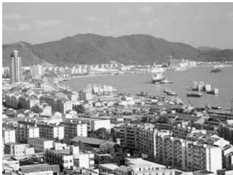
A kétmillió Dinghai egy részlete a kikötővel

– Dinghai város vezetői szívesen fűznék szorosabbra a szálakat Szekszárddal, ezért a szüreti napokra egy kisebb kínai delegáció érkezne – tájé-