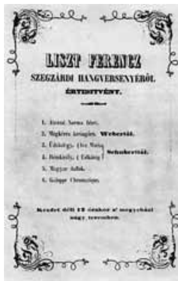
Meghívó a Liszt-hangversenyre