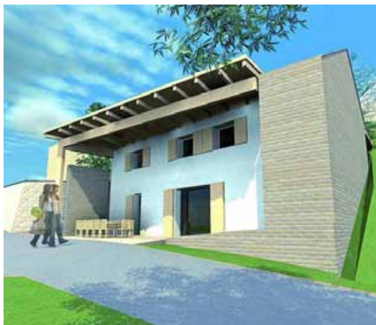
A Nefelejcs közben épülő üzlet látványterve

A példaértékű projekt a környékbeli tudatos fogyasztók mellett a helyi, kézművestermékeket előállítók, mezőgazdasági kistermelők, a megyében működő biogazdaságok körében is népszerűvé válhat. Az elmúlt évek európai és hazai jogszabályváltozásainak eredményeként egyre több helyen növekszik a helyi termékek aránya a lakossági fogyasztásban. A jogszabályi könnyítések mellett közösségi forrásokból indított infrastruktúrafejlesztés segíti a termelők és fogyasztók közvetlen kapcsolatának építését, a környezet-