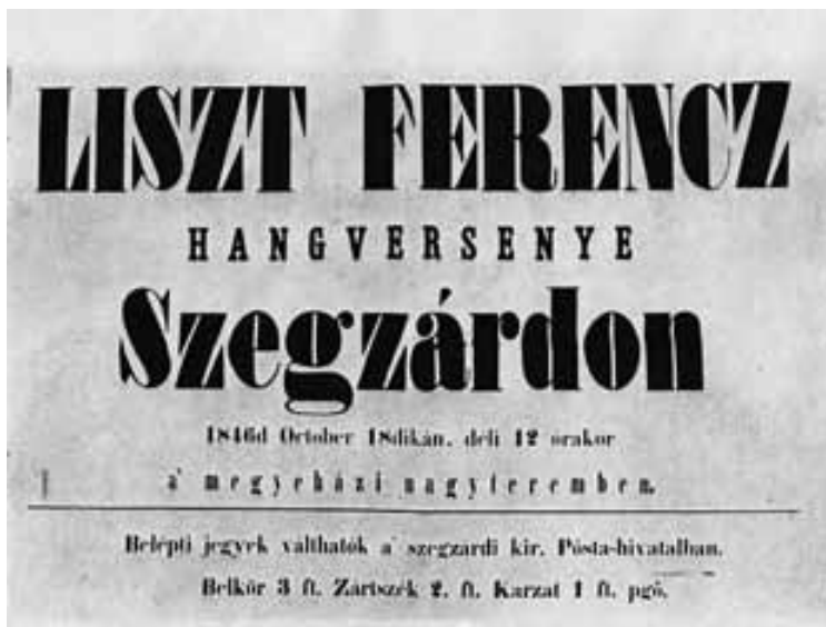
Az első szekszárdi Liszt-hangverseny plakátja

Liszt régi barátja elvesztése miatt érzett fájdalomt ezekben az Ábrányi Kornélhoz írt intézett sorokban juttatta kifejezésre: „Augusz elvesztése a legfájdalmasabban érint. Az esztergomi mise első előadása óta - több mint 20 éve - lélekben egyek voltunk. S ugyancsak ő volt az, aki elhatározásomban, hogy magamat Budapestre kötelezzem, különösen megerősített”.