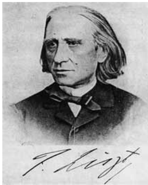
Liszt Ferenc. Eredetije a Zeneművészeti Főiskola Liszt Múzeumában

zonyosnak látszott, hogy Liszt hosszabb időre jön Szekszárdra. „Ezen négy hónap alatt csak viradhatunk valamire művésztünk érdekében a honatyák segedelmével”. Liszt szekszárdi látogatásának három hónapjában, 1870. október 13-án, a vendéglátó házigazda újabb levélben, már egész világosan határozott formában fogalmazza meg előbbi reménykedését: „Ha majd Liszt Pesten lesz, a külföld itt fogja felkeresni őt, a' most élő művészek főnökét, irányítóját - és ezen fényes központ hazánkban és fővárosunkban fog székelní...”