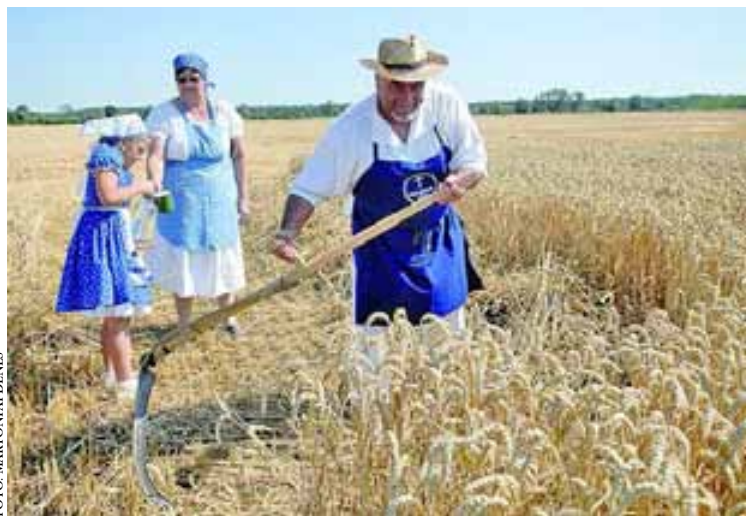
Kaszás, marokszedő és vízhordó kislány a szekszárdi aratónapon