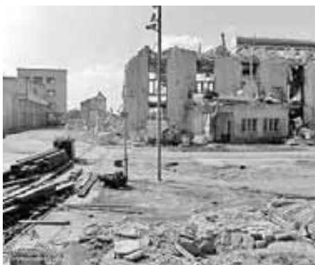
A lebontásra ítélt petőházi cukorgyár 2009 augusztusában