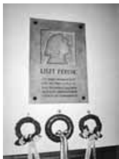
Emléktábla a megyeháza nagytermének falán