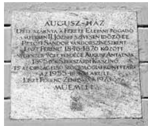
Emléktábla az Augusz-ház keleti homlokzatán