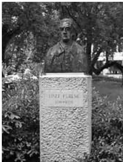
Borsos Miklós a zeneszerzőt ábrázoló mellszobra a Liszt Ferenc téren