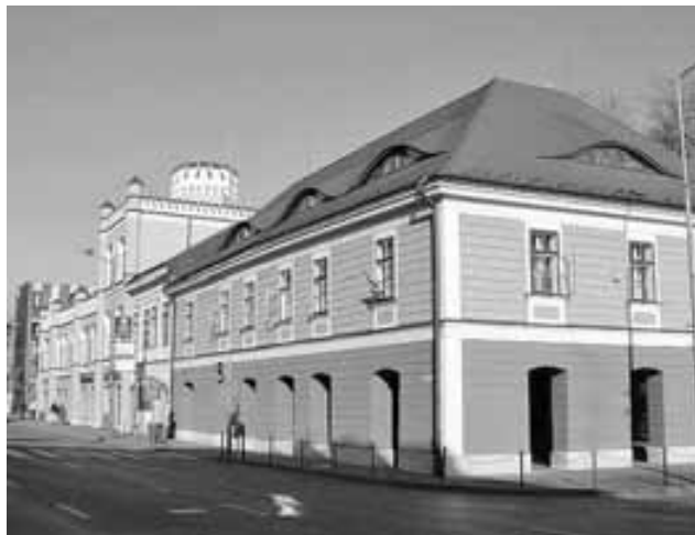
Az Augusz-ház, ahol Liszt négyszer is vendégeskedett. Az épületben működik a róla elnevezett zeneiskola