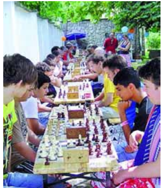
A profik is megküzdöttek egymással

Természetesen nem csak a sakkról szólt ez a nap, hiszen a két forduló kö-