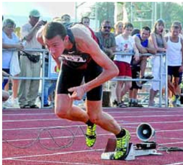
Nyolcsávos futópálya szolgálja a sportolókat