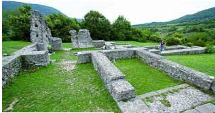
A pilisszentléleki kolostor romjai

A körülöttük lévő hegycsúcsokon pedig – rejtett, köves, sziklás szegélyek mentén haladó utakon – teljes kiterjedésében mutatkoznak meg a Nimród (vagy Sas) csillagkép pontjai. A kutatók kiderítették, hogy a három említett hegyből kettőnél (Árpádvár, Magashegy) szakrális felépítmények helyezkedtek el, de a Rám-hegy tövében is feltételezhető, hogy volt ilyen jellegű objektum. Egyes pálos romoknál utóbb kiderült, négyzetben (egymástól 4,17 km távolságra) helyezkednek el a koponya és a sas csillagképi rajzolon belül. A források alapján tudni lehet – a pálos rend 1250-es alapítása után – az Árpád-házi (Turul nemzetség) királyok a pilisi királyi vadászkastélyaikát átruházták a rend számára. A pálos rend tagjai ezen objektumokat átalakították, s kolostorokat hoztak létre. Rejtélyes, hogy az 1263-as pilisszentléleki királyi kastély átadásánál az építményben már másnap szentmisét tartanak: ez Aradi szerint bizonyíték arra, hogy maga az Árpád nemzetség is korábban vallási funkciókra használta sa-