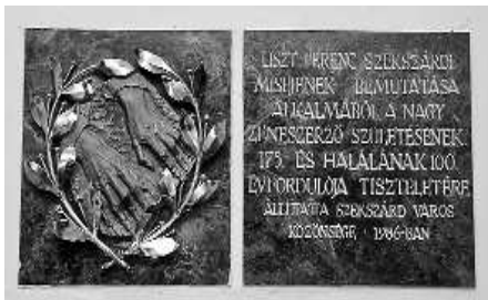
Emléktábla az újvárosi templom karzata alatt