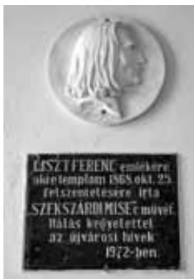
Az újvárosi hívek halás kegyelettel elhelyezett táblája a karzaton