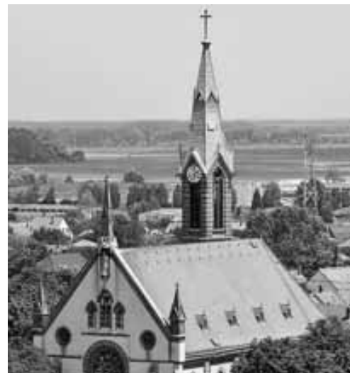
Az újvárosi templom, amelynek 1868. október 25-ei felszentelésére írta Liszt Szekszárdi mise című művét