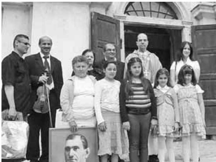
Szekszárdi és bogviszlói cigányok egy kis csoportja Székely János püspökkel, kezükben Ceferinónak, a cigányok védőszentjének a képével

A szentmisét a püspök Bacsmai László plébánossal közösen mutatta be, az asszisztenciába vonva Kocsis