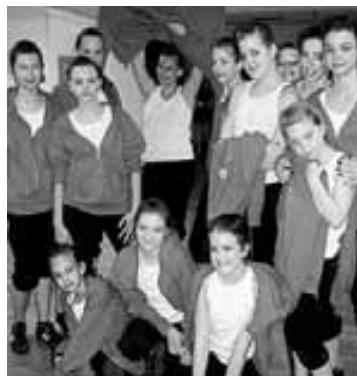
A felvétel idén májusban a pécsi Apáczai Táncfesztiválon készült

– Pécssett 2011 májusában az Országos Művészeti Fesztiválon mutatkoztunk be, s minden korcsoportunk győzött, elsők között voltunk és érmeikkel tértünk haza. Legközelebb a Szekszárdi Szüreti Fesztiválon lépünk színpadra, melynek állandó szereplői vagyunk, s itt szeretnénk bemutatni azt a koreográfiát, amit az idei balato-