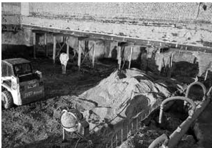
Folyik a pincszinti szerkezetek kiépítése a művelődési házban

A projekt összköltsége: 2 009 586 760 Ft Támogatás: 1 712 548 112 Ft Saját forrás: 297 038 648 Ft Építési beruházás: 1 987 500 000 Ft