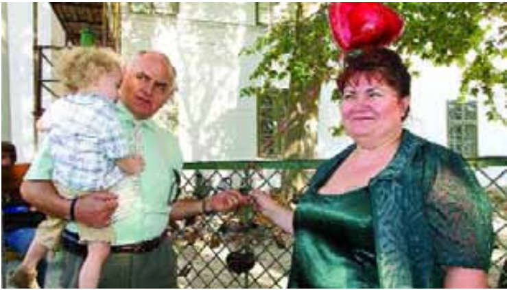
Az első lakatot elhelyezett pár már kisfiát is elhozta a találkozóra

Délután öt óra, jó kis társaság áldogál a régi vármegyeháza kerítése mellett. Ott, ahol több mint kétszázötven feliratos szerelem-lakat díszlik, amelyeket összeházasodott párok kattintotak föl annak idején, hogy megpecsételjék egymás iránti gyengéd érzéseiket. Picit arrébb asztalka, a vázákban virágok, a tálcákon pogácsa, mellette koccintásra váró poharak.