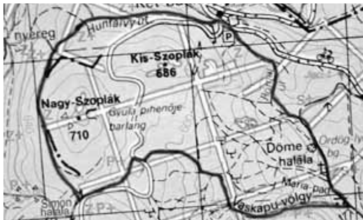
A titkos, kövekkel szegélyezett ösvények által kirajzolódó koponyalakzat a Pilis közepén