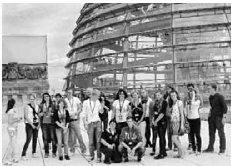
Barátaikkal Berlinben, a Reichstag kupolájánál

Serényen fényképeztünk Schönbrunn színeiben pompázó virágágyásai között, ugyanúgy, mint korábban a Belvedere kastély parkjában.