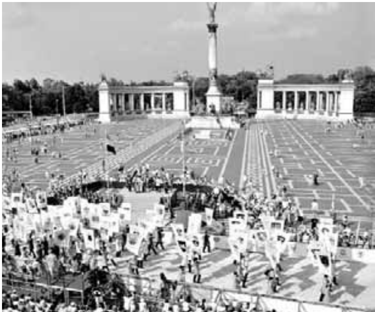
A látványos esemény a budapesti Hősök terén lesz

vesz részt a versenyen. A várhatóan ezúttal is mintegy 200 ezer látogatót vonzó hagyományos fővárosi eseményen idén lesz országgyűlési, bor- és pálinkafalu és kézművesvásár is.