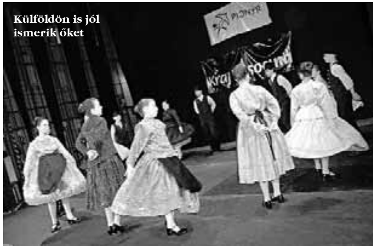
Külföldön is jól ismerik őket

– Az általános iskolából kikerült gyerekek annyira megszerették a táncot, hogy továbbra is szeretnék volna folytatni, ez volt az a pont, amikor lépniük kellett. Felvettük a kapcsolatot a művelődési házzal, ott kaptunk próbahelyet a nagycsoportosoknak, és a kicsik maradhattak a IV-es iskolában.