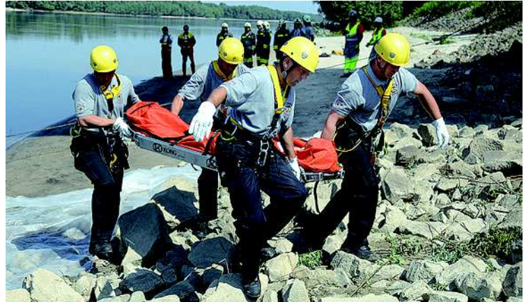
Mentés a májusi IRISZ nemzetközi katasztrófavédelmi gyakorlaton

Az elektronikus hírközlés világában percekben belül értesülhetünk róluk, míg régebben az újságokon keresztül sokkal lassabban kerültek el hozzánk ezek a hírek. A katasztrófavédelemtől kapott információk percek alatt bejárják a világsajtót. Nekünk alapfeladataink ellátása mellett kötelességünk is a tájékoztatás. A másik ok, hogy a földtörténet során – ahogy az ember életében is – a valószínűen bekövetkező katasztrófák ciklikusan, azon belül sűrűbben, vagy ritkábban jelentkeznek – jelenleg a sűrűsödés időszakát éljük. Ma már bizonyított tény a klímaváltozás hatása, amely egy globális folyamat. Az üvegházhatást előidéző gázok, mint a szén-dioxid a légkör folyamatos melegedését okozzák. Hajlamosak vagyunk legyinteni, néhány tized fok átlaghőmérséklet-emelkedésre. Ha megtudjuk, hogy ez a kis változás többek között a gleccserek felének végleges eltűnését, egyes állatok kipusztulását, több korábban lakott sziget tengeri elöntését okozta – talán komolyabban vesszük. A jelenlegi felmelegedést előidéző szén-dioxid-mennyiség már rég a levegőben van. A hatás egyre gyorsul és többszöröződik. A szeleket és csapadékot a tengerek feletti víz körforgása alakítja, melyet a hőmérséklet közvetlenül befolyásol. Hazánkban a felmelegedés jeleit közvetlenül az átlaghőmérséklet emelkedése, egyes fák kipusztulása, nem honos kártevők megjelenése során, közvetetten az időjárási szélsőségek zámának növekedése okán tapasztaljuk. Ezek a hatások a többi veszélyhelyzettel, bizo-