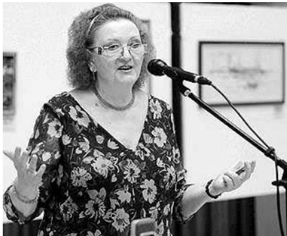
Jókai Anna író is az ügy mellé állt

A mostani rendezvény természetesen konkrét célt is hordozott, a kiállított képek megvásárolhatók és a befolyó bevételt teljes egészében az emberi életek megmentéséért nehéz körülmények között dolgozó légimentő-szolgálatnak ajánlják fel. A kiállítás szeptember 9-ig volt látható, ha valaki festményvásárlással szeretne hozzájárulni a légimentők működésének költségeihez, akkor immár közvetlenül az alkotókhoz fordulhat. Támogatás befizethető a Magyar Légimentő Nonprofit Kft. számlájára is, amelynek száma: 10032000-00288561-00000017.