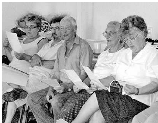
Rendszeresen tartják a kapcsolatot