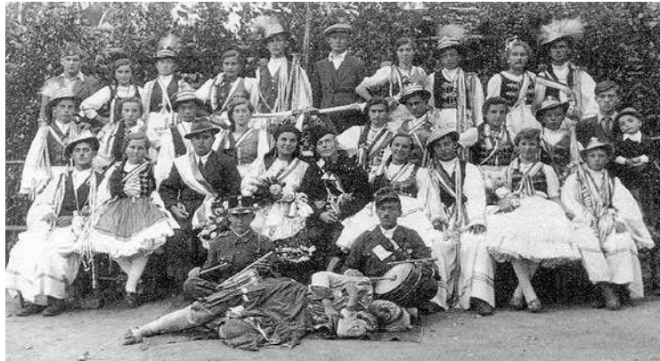
Csoportkép a '40-es évek második feléből Balázs-Kovács Sándor néprajzkutató Sárpilis című könyvéből

óra és este hét között vonultak a szüreti bálozók. A csőszleányok gyönyörű népviseletben, a csőszlegények szintén ilyen viseletben, sarkantyús csizmában tették meg az utat. A vonulókat