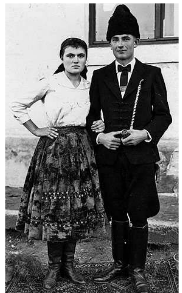
A bálók állandó szereplője volt a bíró és a bíróné