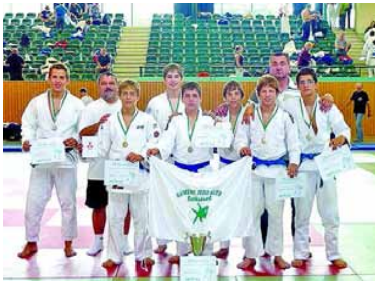
A csapat a németországi verseny után