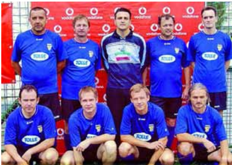
A szekszárdi önkormányzat csapata