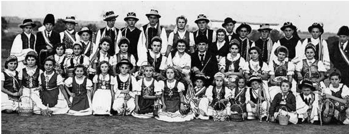
Egy szekszárd-szőlőhegyi felvétel a '60-es évek elejéről

nem szedték a multság szereplőit. A mai Szent István Ház udvarán előkészítve, feldíszítve hatalmas nagy fűrt szőlők lógtak ilyenkor. Az egykori szüreti szokás része volt az is, hogy az esti bálban a csősznek beöltözött legények figyelték, le ne lopják a szőlőt a mulatózók. Akit rajtakaptak, jelképes összegű büntetést kapott, akit nem sikerült a szőlőlopáson elkapni, azt hagyták futni. A bált a szerepek alapján a bíró és a bíróné, a jegyző, valamint a jegyzőné nyitotta meg. A szőlőharang jellegzetes tárgya volt a szüreti bálnak: ezt hagyományosan két markos legény vitte, este a bálban pedig elárverezték, amelyből sok bevétel származott az Olvasókörnek. Korabeli képeink nem az ÚJVárosban készültek. Gyimóthy L.