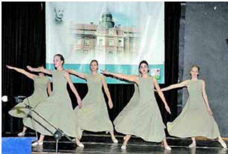
A PTE Gyakorló Általános Iskola Táncművészeti Tagozatának diákjai