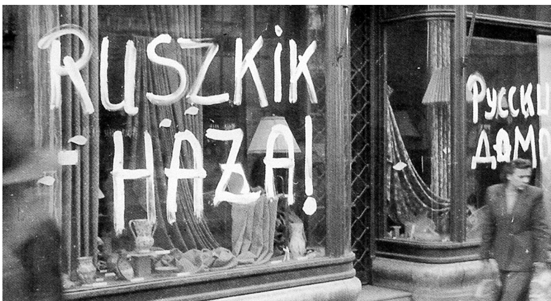
A kommunista elnyomás ellen tiltakozó felirat Budapesten, egy Majakovszkij utcai kirakaton 1956-ban