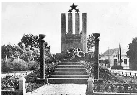
Az egykori szekszárdi Mikos utcai szovjet emlékmű

– Apró Antal, Kádár János, Kossa István és Münnich Ferenc a szovjet csapatok behívásával és itt tartózkodásának legitimizálásával a magyar történelem legnagyobb nemzetárulóiá silányultak. Kádár János igazi nagy bűne nem az volt, hogy gyilkolt, mert amikor közejük csatlakozott, ezt automatikusan vállalnia kellett. A legnagyobb árulása az volt, hogy az ún. „gulyáskommunizmus” meghonosításával legitimizálni próbálta rendszerét. Sajnos, ennek még ma is sok-sok vadhajtsa burjánzik. Az árulokat sohasem lehet szalonképessé tenni, mert a szakvaknak és a mögöttük levő tartalomnak csak egy jelentése lehet. Meglátásom szerint az igazi feltárás és elszámoltatás még várat magára. Gyimóthy Levente