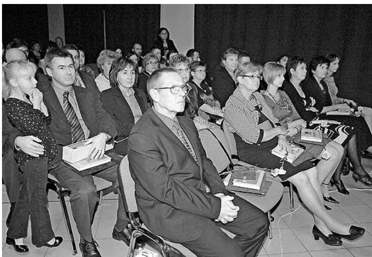
Az első sorokban a kitüntettek foglaltak helyet