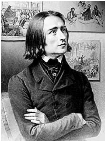
Az ifjú Liszt Ferenc

mellett álló Liszt-szobrot. Horváth István a hangverseny előtti köszöntőjében hangsúlyozta: Liszt és Szekszárd neve összeforrta a zene és a város történetében. Mutatja ezt az is, hogy a világhírű művész négy alkalommal járt városunkban, három alkalommal születésnapját is itt ünnepelte. A polgármester szerint Szekszárd sokat köszönhet Liszt nevének, ám ritkábban teszik fel azt a kérdést: Liszt mit köszönhet Szekszárdnak? Hiszen kevesen tudják, hogy az igazi lokálpatrióta, báró Augusz Antal rengeteget tett azért, hogy Liszt ismert legyen. Harmincöt éves volt a művész, amikor elő-