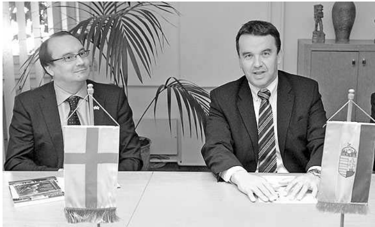
Finnország nagykövete és Szekszárd polgármestere a sajtótájékoztatón

di programjainak lehet része egy a PTE Illyés Gyula Kara által szervezett finn-magyar konferencia is. A nagykövetség és Tornio városa pedig standot, fotókiállítást és filmvetítést tenne hozzá. A szekszárdi és a pécsi konzul segítségével – a gereszlaki finn kolónia összeismertetése révén – kialakulhat egy finn baráti egyesület, amely támogathatja a hivatalos kapcsolatot és a finn programok későbbi szervezését.