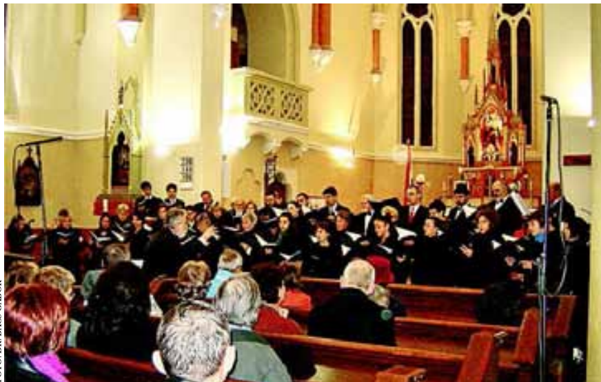
A madrigálkórus az újvárosi templomban adta elő Lisztnek a templom felavatására írt művét

Ezután egyházi témájú művek következtek. Hiszen a mélyen vallásos Liszt érdeklődése az 1850-es évektől az egyházzene felé fordult. Elsőként az Ave Mariat hallhattuk, majd a leghos-