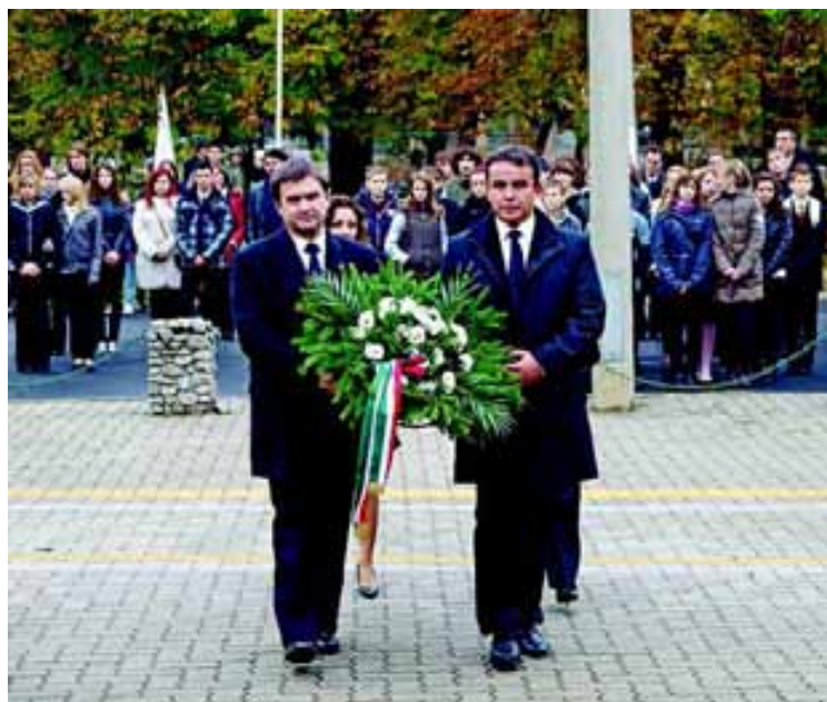
A város vezetői elhelyezték a kegyelet virágait az áldozatok emlékművénel