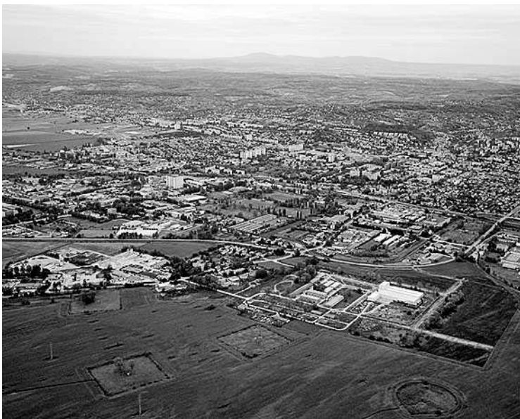
A légi felvétel előterében (jobbról) a közművesített ipari park

– Ha a kollégium felől megnézzük a főiskola homlokzatát, nagyon szomorú kép tárul elénk. Erre is van már egy vázlattervünk. Ez egyelőre csak elképzelés, ami sem jogilag, sem műszakilag nincs alátámasztva, ám kiindulópontnak megfelelhet. Szükséges lenne az energetikájában és funkcionális használatában is igen rossz minőségű kollégium felújítása. Ez igen gyorsan megtérülő beruházás lenne például a megújuló energiaforrások vagy a víz sokkal optimálisabb használata okán is.