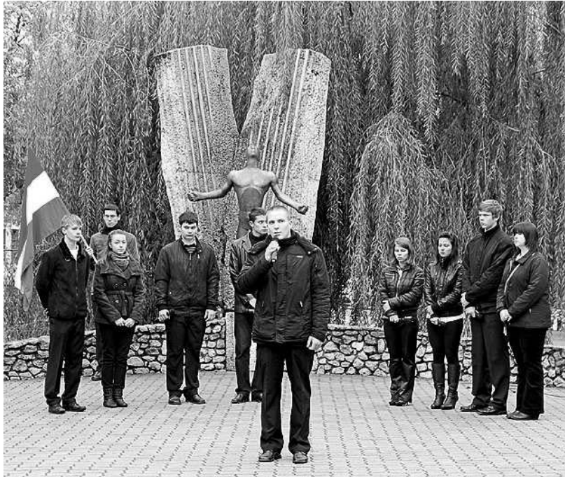
A Szent László Szakképző Iskola Vendéglátó Szakképző Tagintézményének diákjai adtak ünnepi műsort az emlékműnél

Az ünnepség keretében kitüntetések átadására is sor került. Idén Ranga Ferenc és Rendás Tamás a Pofosz érdemkereszt aranyfokozatát, Gyulai István pedig a Pofosz ezüst érdemplakettjét vehette át. Ranga Ferenc részt vett az 56-os forradalomban, Rendás Tamást hosszú évekre fosztották meg szabadságától, míg Gyulai Istvánt szintén meghurcolták a kommunisták. Az emlékezés után az önkormányzat képviselői és a Pofosz elnöksége megkoszorúzták a Városháza földszintjén az 56-osok emléktábláját, majd a résztvevők a Mikos utcai forradalmi emlékműhöz vonultak, ahol Horváth István polgármester ünnepi beszédében rámutatott arra: ő és kortársai még ahhoz a generációhoz tartoznak, akik elől elhallgatták 1956 jelentőségét, s csak szüleiiktől vagy szamizdat lapokból ismerhették meg az igazságot! A polgármester felidézte a szekszárdi eseményeket, amidőn a tüntetők ledöntötték a szovjet hősi emlékművet és megalakították a Nemzeti Bizottság elnökségét a Városházán. Szekszárdon az Ifjúsági Forradalmi Bizottság többek között a szovjet csapatok kivonását, az államosított ingatlanok és szőlők visszaadását, valamint a laktanyák iskola céljára történő hasznosítását követelte – emlékeztetett. A november 4. utáni retor-