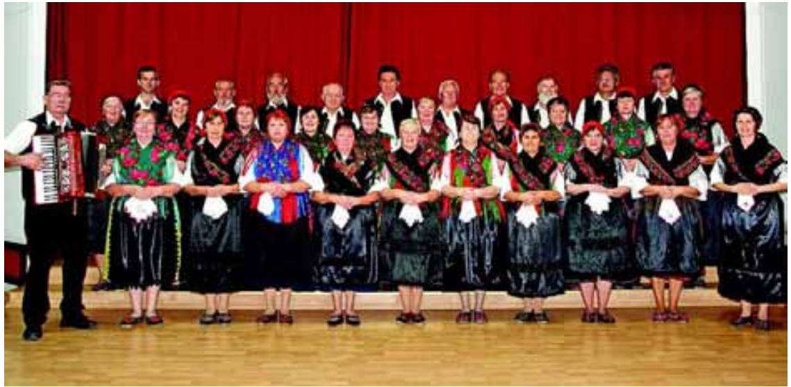
Az együttes nemcsak hangzásában, hanem régi viseleteivel is őrzi a hagyományokat

– Amire mindenekelőtt büszkék vagyunk, hogy kórusunk a saját kategóriájában egyedüli képviselője Szekszárdon a német dalkultúrának. Nemzetközi minősítésünk: 1978-ban Bietigheim-Bissingenben, a testvérvárosi kórusok versenyén: közönségszavazásos különdíj, 2007-ben Hőgyészen dícséretes arany fokozat, 2009-ben Budapesten Nemzetiségi Hagyományörző Kategóriában KOTA Díj, 2009-ben Szekszárdon Klézli Jánosnövődij, 2010-ben Tolnán kitüntetési