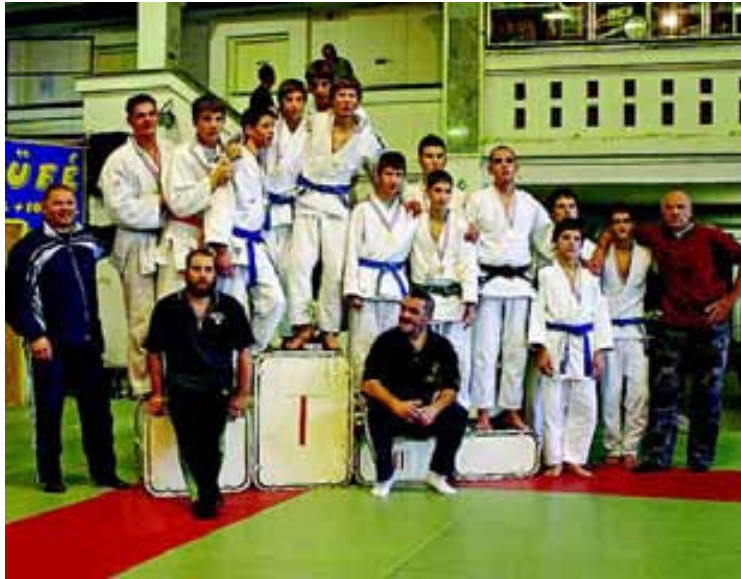
Kitűnő főpróbát tartottak a szekszárdiak a jövő heti egyéni serdülő-ob-re