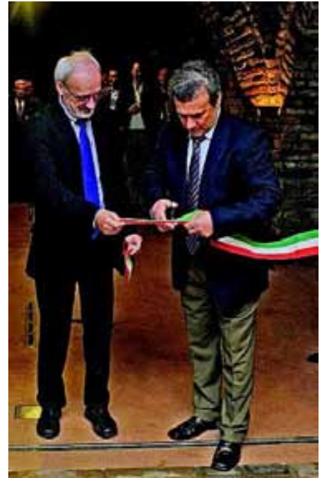
Az új beruházás átadásán Takler Ferenc borással

– Tessék csak jól körülnézni az egyes üzlet típusokban, és máris tapasztalható a változás: nagyobb teret kaptak a garantáltan jó minőségű magyar termékek. De ennél is fontosabbnak tartom azt, hogy a magyar vidéken – szintén egy jogszabály-módosításunk jóvoltából – egyre több élelmiszert állítanak elő házilag, és értékesítik is ott helyben. Ezzel kapcsolatosan a szkeptikusok megjegyezték: jönnek majd a botrányos közegészségügyi problémák, mert az élelmiszer-biztonság nem szavatolt. Ehhez képest egyetlen ilyen ügyről sem tudok, minden a legnagyobb rendben. Nagyon jó minőségű élelmiszerek kerülnek ezáltal az asztalra, sokszor a helyi közétkeztetésbe, ráadásul a kereskedői árrés kiiktatásával garantáltan jó áron is. S az ellenőr-