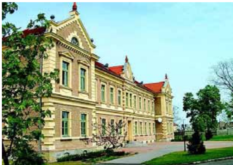
Az intézmény november 25-26-án és december 2-3-án nyílt napon várja az érdeklődőket

Az iskola évente két osztállyal indul, egy 1+4-es és egy 6 évfolyamos csoporttal. A négyosztályos tagozat nulladik éve nyelvi előkészítő. A diákok már a kezdetektől csoportbontásban tanulják a matematikát, idegen nyelvet