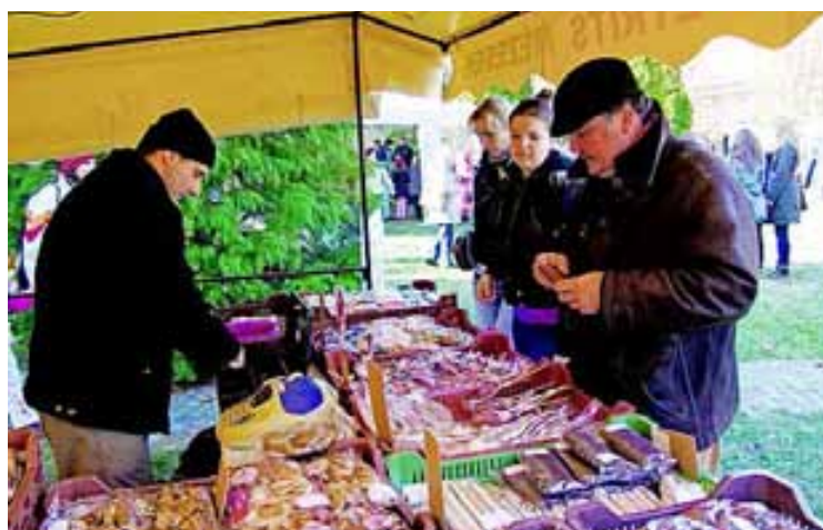
Mézskalácsot is vehettünk a mézek, lekvárok, libasültek mellé