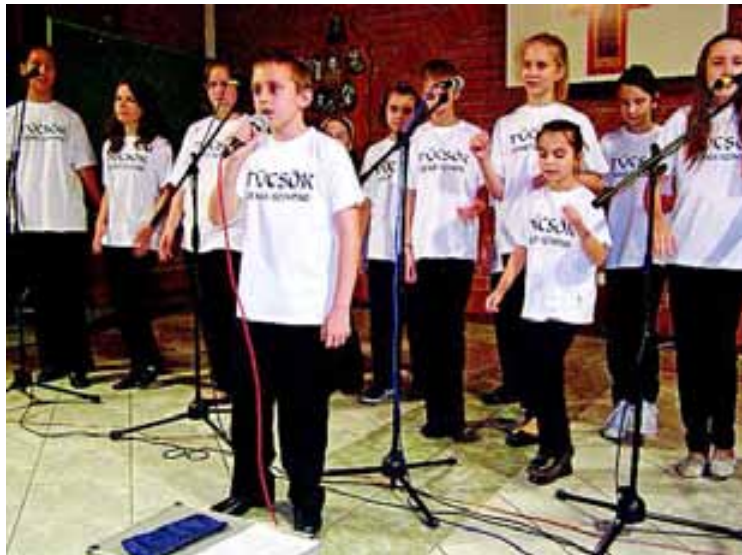
A Tücsök műsora jókedvre derítette a jótékonyági est résztvevőit