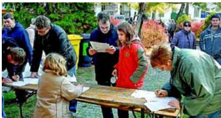
A kitöltött kérdőívek szerint a szekszárdiak szívesen vásárolnának helyi termékeket, csak keveset tudnak róluk

egész nap „diavetítés” mutatta be a helyi termelőket, az árusok pedig szívesen adtak felvilágosítást termékeikről. Mindeközben a Béla tér fűvén régi korok játékaival mulathattak gyerekek százaai a patkódobálástól a hordólovaglásig játékmesterek segítségével. Az esetfelé érkezők sem estek kétségbe, amikor a sokak által jól ismert Toma és csapata már hazament, hiszen a legősibb játék, a faramászás még mindig rendelkezésre állt.