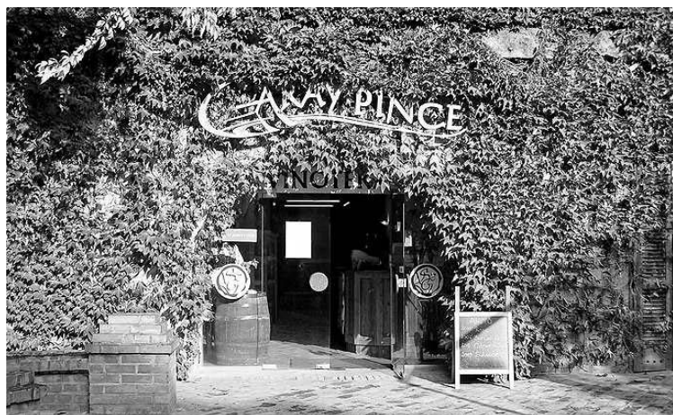
A Garay Pince bejárata