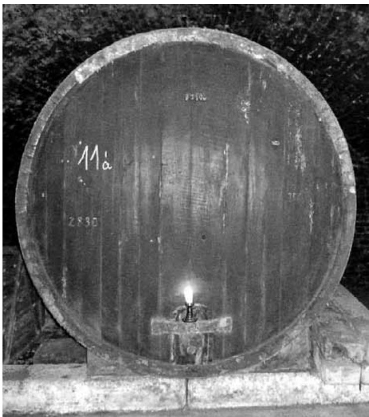
A pince legnagyobb fahordója, melynek űrmértéke 93,1 hektoliter