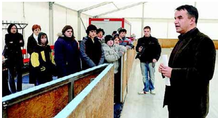
Horváth István polgármester sajtótájékoztatója a műjégpályán

Ötödik alkalommal nyitja meg kapuit december 3-án, szombaton délelőtt a szekszárdi műjégpálya, amelyen ezen a napon ingyenesen korizhatunk. A Szekszárdi Víz- és Csatornamű Kft. által üzemeltetett jégpálya a megye egyetlen fedett létesítménye. Népszerűségét jól mutatja, hogy tavaly mintegy 15 ezer látogatója volt – mondta el csütörtöki, helyszíni sajtótájékoztatóján Horváth István. A polgármester hangsúlyozta: szándékuk továbbra is az, hogy minél többen ismerkedjenek meg a korcsolyázással, ezért a helyi óvodások és iskolások szervezett formában idén is ingyenesen látogathatják délelőttönként a koripályát. Horváth István szerint örömteli, hogy a jégkorongsport