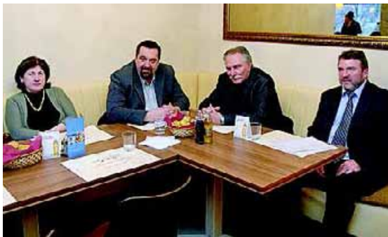
A cég képviselői szeretnék hozzájárulni a belváros levegőminőségének javításához