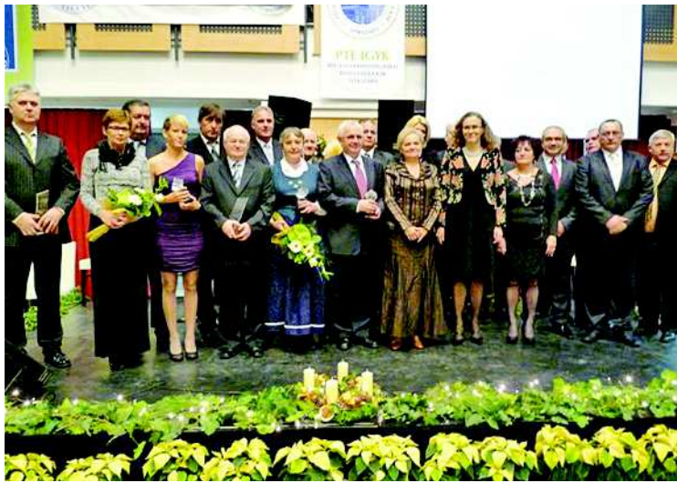
Prima díjasok, az év vállalkozói és a támogatók

„Akit ma név szerint fognak szólítani, minden szempontból nagy megbecsülésnek örvendhet. Természetesen ehhez olyan életút, egyéni siker, a közösségi életben elért eredmények szükségesek, amelyek megalapozzák az egyhangú döntést. Tolna megye e