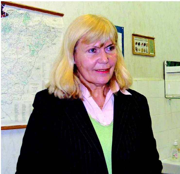
FOTÓ: V. VERECKI ANITA

– A minap egyik fiam ugyanezt kérdezte tőlem. Nézze, a faluban mi orvost nem láttunk, csak amikor átjött a harmadik településről. Viszont tanítóknak – pontosabban tanító úr – volt helyben. Ő volt az értelmiségi, a mintakép. Szüleink a térszékben dolgoztak, bennünket a nagyszülők neveltek. Az „aszaltszilva arcú” igen vallásos nagyanyám a boltba egyszerre csak fél liter petróleumért küldött, egy fél kiló cukorért. Többet nem engedhettünk