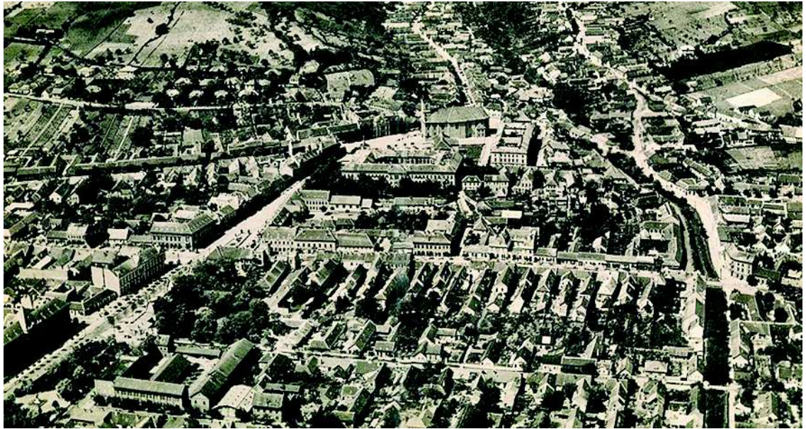
Egy légifelvétel a 30-as évekből, jobbról a még lefedetlen Séd-pattakkal

A Remete-hegyen városi vízgűjtőt, a Dunánál egy vízmű építését gondol-