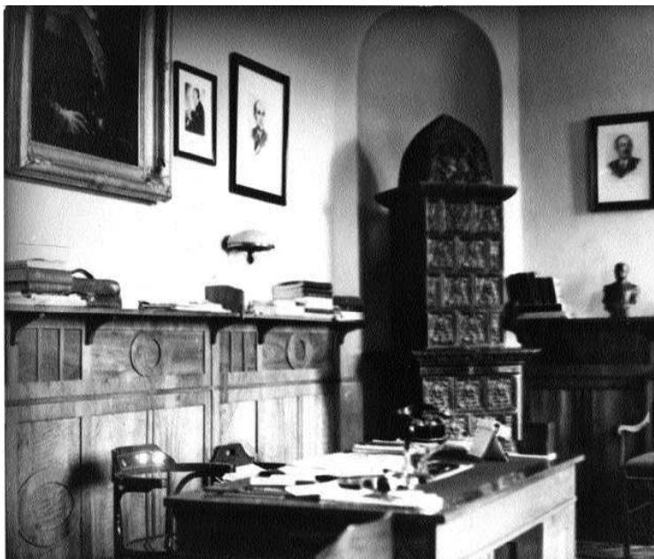
Hivatali szoba

A választmány még annak a látszatát is el akarta kerülni, hogy eleve a vaskály-