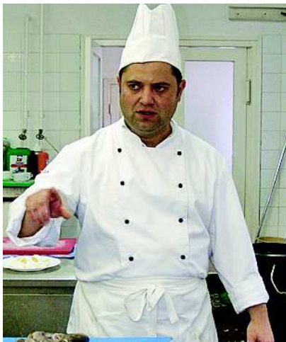
Sill Attila gesztenyész pulykát javasol

BDG BESE & DÖRMER & GLÓSZ BT. SZIGMA KOMFORT